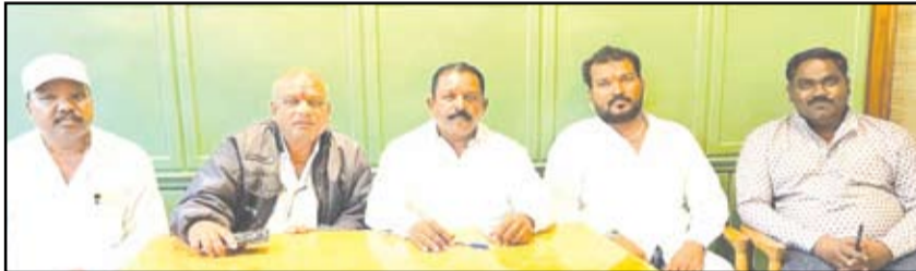
अनुसूचित जातींच्या आरक्षणाचे उपवर्गीकरण करण्याबाबत महाराष्ट्र शासनाने तातडीने निर्णय घेऊन तो लागू करावा, अन्यथा १६ जुलै रोजी अहिल्यानगर जिल्हाधिकारी कार्यालयावर भव्य मोर्चा काढण्यात येईल, असा इशारा सकल मातंग समाज महाराष्ट्रच्या वतीने घेण्यात आलेल्या पत्रकार परिषदेत देण्यात आला.

नगर - अनुसूचित जातींच्या आरक्षणाचे उपवर्गीकरण करण्याबाबत महाराष्ट्र शासनाने तातडीने निर्णय घेऊन तो लागू करावा, अन्यथा १६ जुलै रोजी अहिल्यानगर जिल्हाधिकारी कार्यालयावर भव्य मोर्चा काढण्यात येईल, असा इशारा सकल मातंग समाज महाराष्ट्रच्या वतीने घेण्यात आलेल्या पत्रकार परिषदेत देण्यात आला.