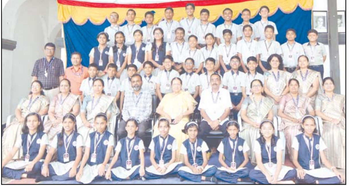
शिष्यवृत्ती परीक्षा २०२५-२६ मध्ये यश मिळविलेले अहमदनगर एज्युकेशन सोसायटीच्या भाऊसाहेब फिरोदिया हायस्कूलचे विद्यार्थी.

नगर - अहमदनगर एज्युकेशन सोसायटीच्या भाऊसाहेब फिरोदिया हायस्कूलने पूर्व उच्च प्राथमिक (इयत्ता पाचवी) आणि पूर्व माध्यमिक (इयत्ता आठवी) शिष्यवृत्ती परीक्षा २०२५-२६ मध्ये यश संपादन करत शैक्षणिक गुणवत्तेची उज्वल परंपरा कायम राखली आहे. या दोन्ही परीक्षांमध्ये एकूण ३९ विद्यार्थ्यांनी जिल्हाच्या गुणवत्ता यादीत स्थान मिळवत शाळेच्या शिरपेचात मानाचा तुरा रोवला आहे.