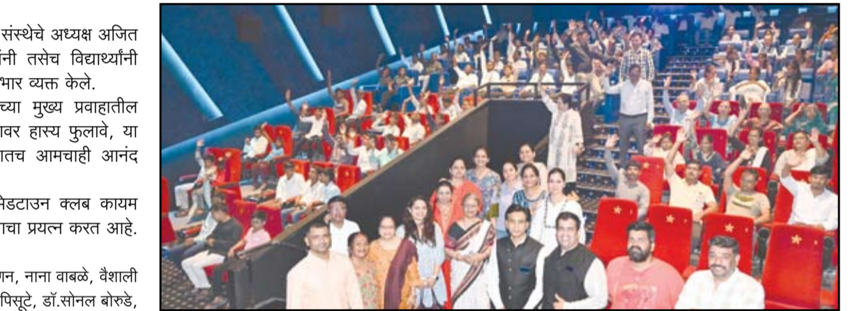
अनामप्रेम संस्थेतील विद्यार्थ्यांसाठी नगरच्या रोटरी क्लब मिडटाउनच्या वतीने सध्या गाजत असलेल्या ‘देऊळ बंद २’ या मराठी चित्रपटाचा विशेष शो आयोजित करण्यात आले होते.