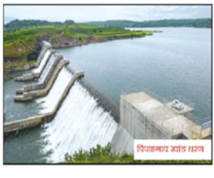
पिंपळगाव येथे धरण

नगर - अहिल्यानगर शहराची तहान भागवणाऱ्या मुळा धरण क्षेत्रात जोरदार पाऊस सुरु आहे. त्यामुळे धरणातील पाणीसाठाही वेगाने वाढू लागला आहे. ८ जुलै रोजी सकाळी घेतलेल्या नोंदीनुसार एकाच दिवसात धरणात सुमारे दीड टीएमसी नवीन पाण्याची आवक झाली आहे. मुळा पाणलोट क्षेत्रात एकाच दिवसात सर्वाधिक १२३ मिमी पावसाची नोंद झाली आहे. धरणाच्या पाणलोटत सध्या जोरदार पाऊस सुरु असल्यामुळे मुळा धरणात मोठ्या प्रमाणात पाण्याची आवक होत आहे.