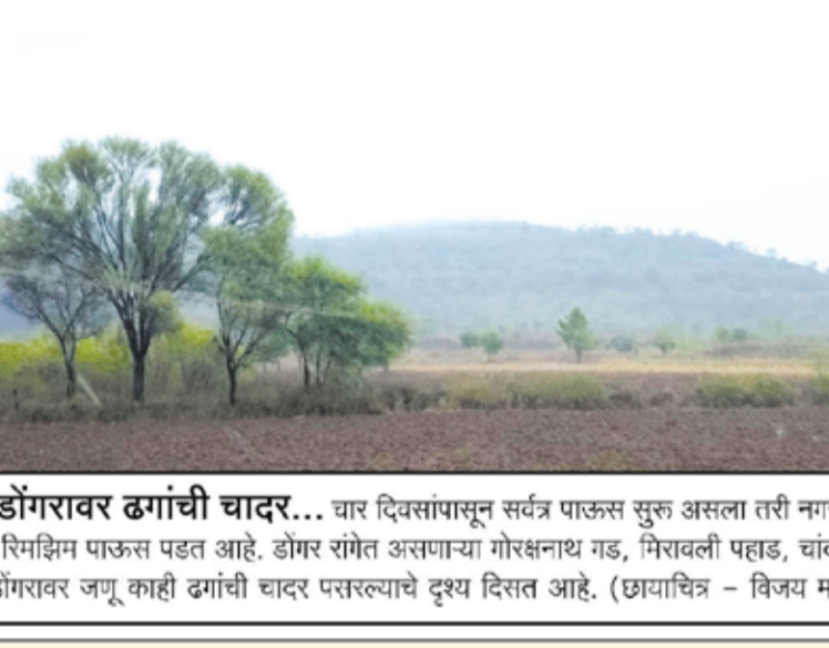
डोंगरावर ढगांची चादर... चार दिवसांपासून सर्वत्र पाऊस सुरु असला तरी नगर तालुक्यात मात्र रिमझिम पाऊस पडत आहे. डोंगर रांगेत असणाऱ्या गोरक्षनाथ गड, मिरावली पहाड, चांदबीबी महाल या डोंगरावर जणू काही ढगांची चादर पसरल्याचे दृश्य दिसत आहे.