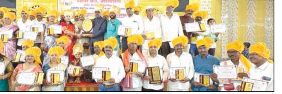
लक्ष्मीनारायण मंगल कार्यालयात आयोजित मेळाव्यात प्रशासकीय अधिकारी, सामाजिक कार्यकर्ते, शिक्षक, उद्योजक आणि विविध क्षेत्रात उल्लेखनीय कामगिरी करणाऱ्या कर्तृत्ववान व्यक्तींना राज्यस्तरीय पुरस्कार प्रदान करून गौरविण्यात आले.

विविध क्षेत्रातील कर्तृत्ववान व्यक्तींना राज्यस्तरीय पुरस्काराने सन्मान; यशवंत सेना व जय मल्हार शैक्षणिक संस्थेचा उपक्रम