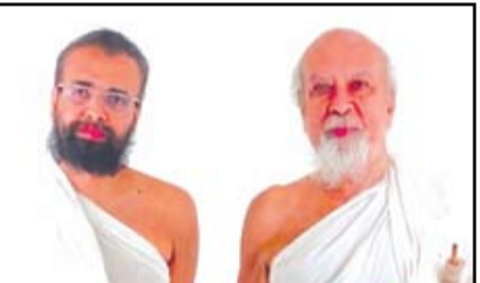
की दुर्लभता’ या विषयावर हिंदीतून व्याख्यान होईल.