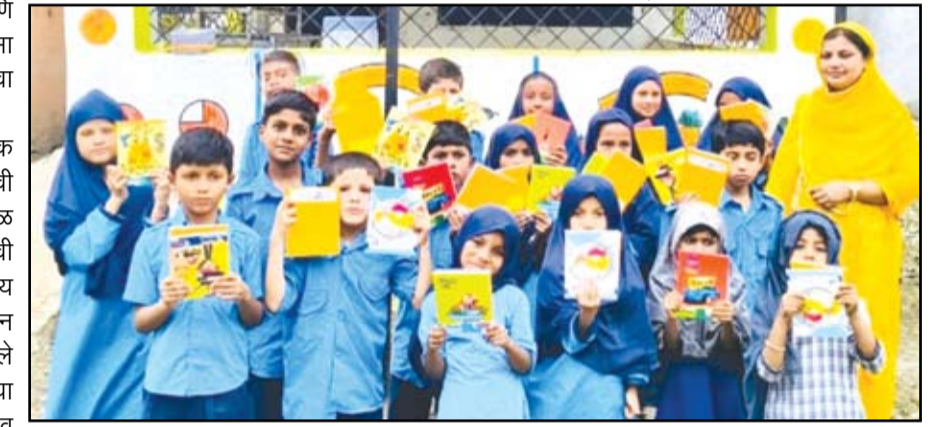
मखदुम सोसायटीतर्फे जिल्हा परिषद प्राथमिक शाळेतील विद्यार्थ्यांना मोफत वह्या वाटप करण्यात आले.