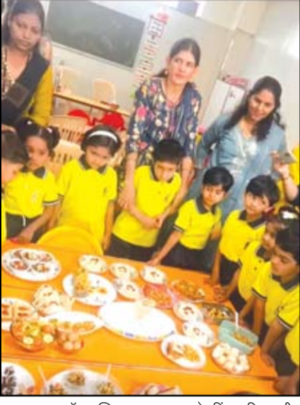
द आयकॉन पब्लिक स्कूलच्या फ्लेजलिंग्स विभागातील विद्यार्थ्यांसाठी त्यांच्या मातांसोबत फायरलेस कुकिंग उपक्रमाचे आयोजन करण्यात आले होते.

नगर - द आयकॉन पब्लिक स्कूलच्या फ्लेजलिंग्स विभागातील विद्यार्थ्यांसाठी त्यांच्या मातांसोबत फायरलेस कुकिंग उपक्रमाचे आयोजन करण्यात आले. या उपक्रमामुळे विद्यार्थी आणि त्यांच्या मातांंना एकत्र शिकण्याची, सर्जनशीलतेला वाव देण्याची संधी मिळाली. घरी आई मुलांसाठी स्वयंपाक करत असते. शाळेतील या उपक्रमात मुलांना आईसह आनंददायी वातावरणात स्वयंपाक करण्याचा अनुभव मिळाला. विद्यार्थ्यांनी आपल्या