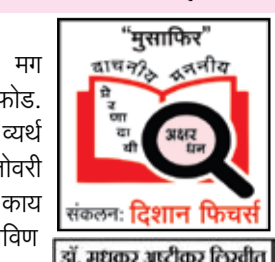
संकलन: दिशाण किचर्स