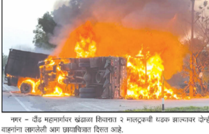
नगर - दौंड महामार्गावर खंडाळा शिवारात २ मालट्रकची धडक झाल्यावर दोन्ही वाहनांना लागलेली आग छायाचित्रात दिसत आहे.