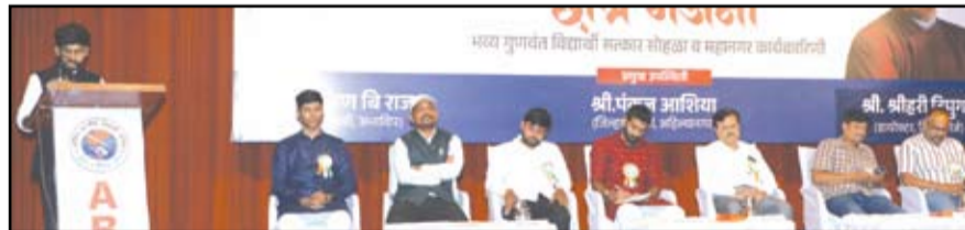
अखिल भारतीय विद्यार्थी परिषद दक्षिण अहिल्यानगर जिल्हाच्या वतीने आयोजित विद्यार्थी परिषद.

नगर - अखिल भारतीय विद्यार्थी परिषद दक्षिण अहिल्यानगर जिल्हाच्या वतीने ९ जुलै रोजी विद्यार्थी परिषद स्थापना दिवस व राष्ट्रीय विद्यार्थी दिवसाचे औचित्य साधून छात्र गर्जना - भव्य गुणवंत विद्यार्थी सत्कार सोहळा व महानगर कार्यकारिणी घोषणा या कार्यक्रमाचे आयोजन