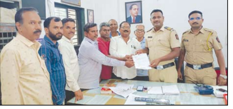
कल्याण रोड परिसरात पोलीसांनी रात्रीची गस्त वाढवावी या मागणीचे निवेदन तोफखाना पोलिसांना देताना नागरिक.