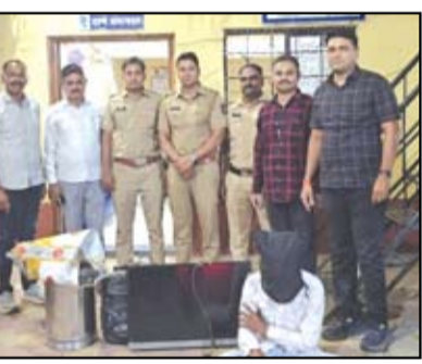
भिंंगारच्या नाईट स्कूलमध्ये चोरी करणाऱ्या आरोपीला पकडण्यात नगर पोलीस पथक.