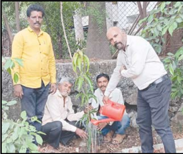
जागतिक पर्यावरण दिनानिमित्त शहरातील जानकीबाई आपटे मूकबधिर विद्यालयात भारतीय लहुजी सेनेच्या वतीने वृक्षारोपण अभियान राबविण्यात आले.