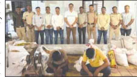
शेख (वय २५, रा. बाराईमाम, कोठला) याला ताब्यात घेण्यात आले. त्याच्याकडून मावा तयार करण्यासाठी लागणारी सुपारी, सुगंधी तंबाखू, मावा बनविण्याची मशीन तसेच तयार मावा असा १ लाख ६६ हजार ५५० रुपयांचा मुद्देमाल जप्त करण्यात आला.

नगर - तोफखाना पोलीस ठाण्याच्या हद्दीत अवैधदरिच्या मावा व सुगंधी तंबाखू तयार करणाऱ्या दोन ठिकाणांवर एमआयडीसी पोलिसांनी धडक कारवाई करत ३ लाख ३४ हजार ७५० रुपयांचा मुद्देमाल जप्त केला. या कारवाईत दोन जणांना ताब्यात घेण्यात आले असून त्यांच्याविरुद्ध तोफखाना पोलीस ठाण्यात गुन्हे दाखल करण्यात आले आहेत.