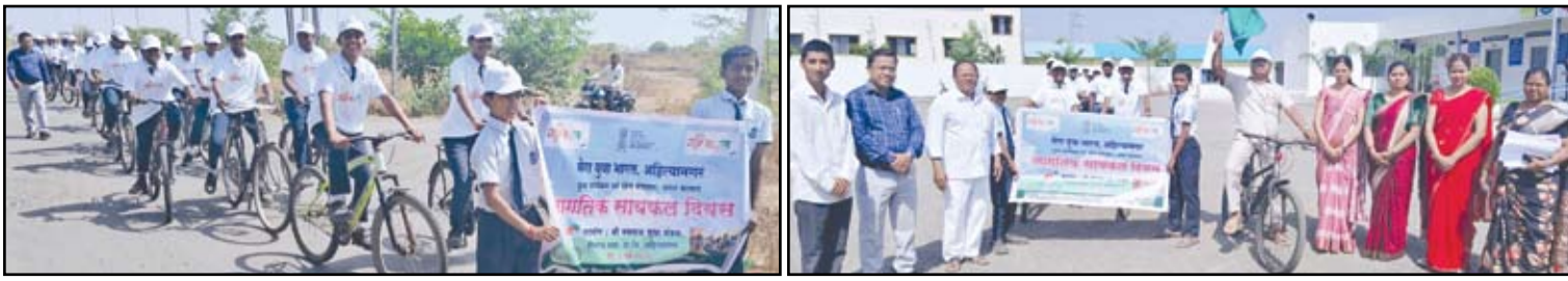
जागतिक सायकल दिनाचळ विद्यार्थ्यांची जनजागृती रॅली काढण्यात आली.