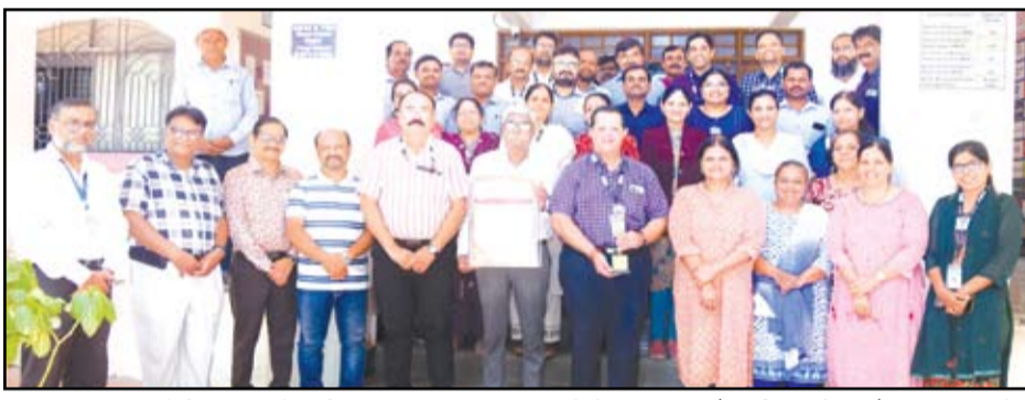
गुणवत्तापूर्ण शिक्षणासाठी अहिल्यानगरच्या आयएमएससीडीआरला 'ट्रस्टेड व्हिजनरी कॉलेज ऑफ द ईयर २०२६' पुरस्कार मिळाला.

नगर - बी.पी.एच.ई. सोसायटीच्या इन्स्टिट्यूट ऑफ मॅनेजमेंट स्टडीज, करिअर डेव्हलपमेंट अँड रिसर्च (आय.एम.एस.सी.डी.आर.) या संस्थेची India Elite Education Institutional Excellence Awards Conference 2026 - National Edition साठी निवड झाली असून, संस्थेला Trusted Visionary Business Management Studies College of the Year 2026 - Maharashtra Award या राज्यस्तरीय मानाच्या पुरस्काराने गौरविण्यात आले आहे. संस्थेचा शैक्षणिक व प्रशासकीय दर्जा, गुणवत्तापूर्ण शिक्षण, उत्कृष्ट प्लेसमेंट्स तसेच आधुनिक पायाभूत सुविधांची दखल घेत परीक्षक समितीने आय.एम.एस.सी.डी.आर.ची निवड केली. Quality Education, Excellent Administration, Placements Infrastructure या श्रेणीत हा पुरस्कार प्रदान करण्यात आला. पुरस्कार वितरण सोहळा २९ मे रोजी बंगळुरू येथील 'ताज वेस्ट एन्ड' हॉटेलमध्ये पार पडला. या पुरस्कारासाठी संस्थांचे विविध निकषांच्या आधारे मूल्यमापन करण्यात आले. त्यामध्ये विद्यार्थीकेंद्रित शिक्षणपद्धती, अनुभवी व संशोधनाभिमुख प्राध्यापकवर्ग, उद्योगाभिमुख अभ्यासक्रम, कौशल्यविकासासाठीचे प्रशिक्षण उपक्रम, प्लेसमेंटची गुणवत्ता,