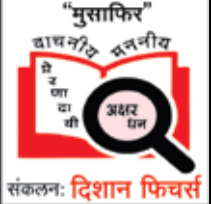
संकलन: दिशान फिक्स