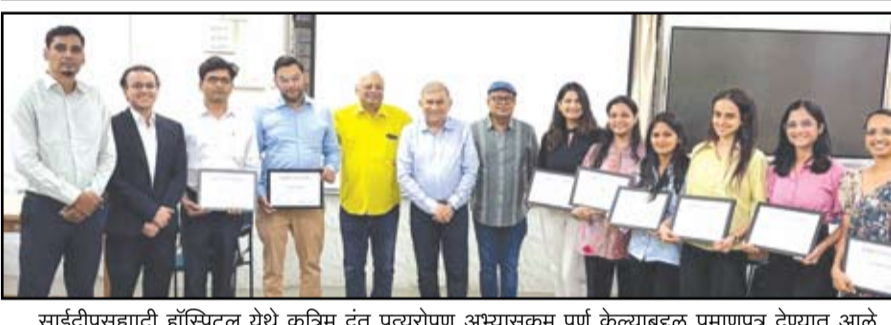
साईदपसह्याद्री हॉस्पिटल येथे कृत्रिम दंत प्रत्यारोपण अभ्यासक्रम पूर्ण केल्याबद्दल प्रमाणपत्र देण्यात आले.