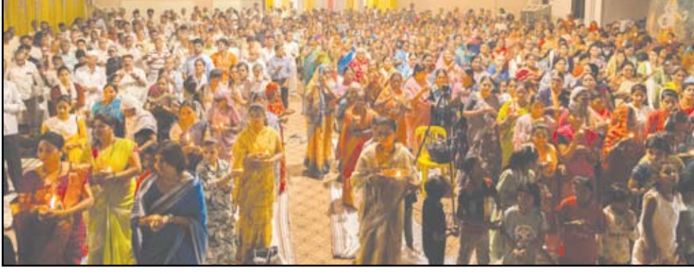
इस्कॉनचे वतीने आयोजित करण्यात आलेल्या श्रीमद् भागवत कथा निरूपण सोहळ्याच्या सांगतेप्रसंगी श्रीकृष्णलिला सादर करण्यात आली. शेजारील छायाचित्रात उपस्थित असलेले भाविक.