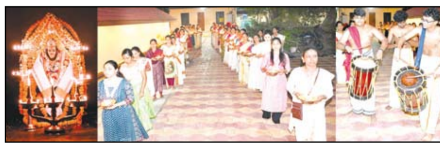
भगवान श्री अय्यप्पा मंदिराचा ३२ वा प्रतिष्ठापना वार्षिकोत्सव भक्तीभावाने आणि उत्साहात साजरा झाला. यानिमित्ताने केरळच्या पारंपरिक चेंडा मेलम आणि इतर वाद्यांच्या गजरात निघालेल्या शोभायात्रेत भाविक पारंपरिक वेशभूषेत सहभागी झाले.

नगर - अहिल्यानगर येथील भगवान श्री अय्यप्पा मंदिराचा ३२ वा प्रतिष्ठापना वार्षिकोत्सव भक्तीभावाने आणि उत्साहात साजरा झाला. शकडो भाविकांच्या 'स्वामीये शरणम अय्यप्पा' च्या जयघोषाने परिसर दुमटुमून गेला. यानिमित्त आयोजित विविध धार्मिक विधींमध्ये, महापूजा, शोभायात्रेत भाविकांनी सहभाग नोंदविला. यावेळी काढण्यात आलेली शोभायात्रा वार्षिकोत्सवाचे प्रमुख आकर्षण ठरले. केरळच्या पारंपरिक चेंडा मेलम आणि इतर वाद्यांच्या गजरात निघालेल्या शोभायात्रेत महिला भाविक पारंपरिक वेशभूषेत नारळाच्या करवंट्यामधील दिवे घेऊन तेथेच पुरुष भाविक व अय्यप्पा सेवा समितीचे पदाधिकारी उत्साहाने सहभागी झाले होते.