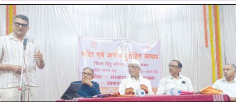
टिळक रोड येथील पटेल मंगल कार्यालयात अहिल्यानगर जिल्ह्यातील मंदिर, विश्वस्त, पुजारी यांच्या बैठकीचे आयोजन विश्व हिंदू परिषद मंदिर, अर्चक, पुरोहित आयामाच्या वतीने करण्यात आले होते.

ताळाळ रद्द करण्यात यावा : अहिल्यानगर जिल्ह्यातील मंदिर विश्वस्तांची व्यापक बैठक