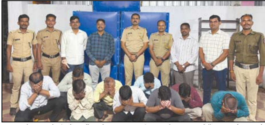
शहरातील बागडपट्टी, मंगलगेट, सर्जेपुरा परिसरात जुगार अड्यांवर कारवाई करून १२ आरोपींना ताब्यात घेण्यात आले.