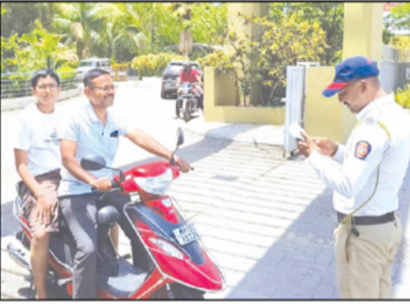
जिल्हा पोलीस अधीक्षक कार्यालयाच्या प्रवेशद्वारावर विनाहेल्मेट घेणाऱ्या पोलिसांवर कारवाई करताना शहर वाहतूक शाखेचे कर्मचारी.