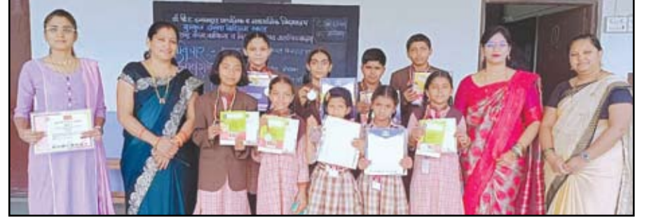
ऑलिम्पियाड परीक्षेत यश मिळविलेले गुरुकुल इंग्लिश मीडियम स्कूलचे विद्यार्थी.