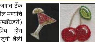
आवश्यक असलेले सर्व साहित्य पुरवले जाईल. या कार्यशाळेदरम्यान, सहभागींना साध्या टी-शर्ट्स आणि टॉपस्वर मण्यांचे नक्षीकाम करून त्यांना एक नवीन आणि आकर्षक लूक कसा द्यायचा, हे शिकवले जाईल. अहिल्यानगरमध्ये अशा प्रकारची कार्यशाळा पहिल्यांदाच होत असल्याने, इच्छुक विद्यार्थी आणि महिला १९६०५१७७७९ या क्रमांकावर संपर्क साधून आपली नोंदणी करू शकतात.