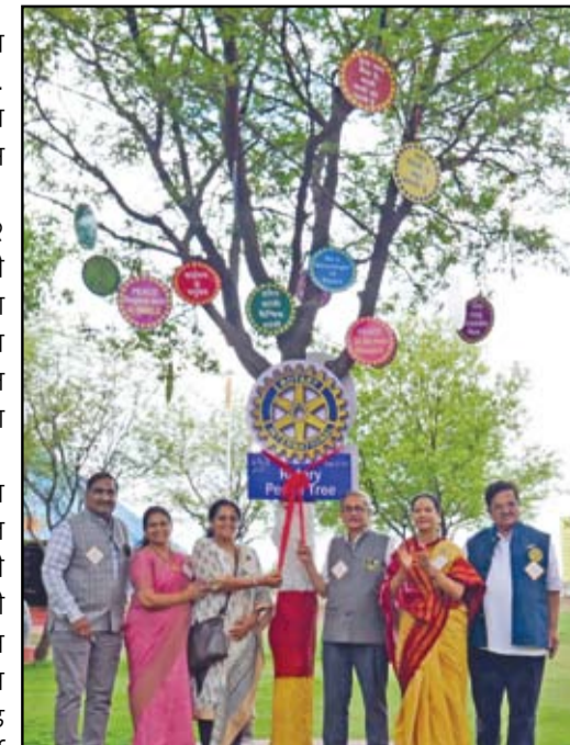
साईबन कृषी पर्यटन क्षेत्रात शांततेचा संदेश देणाऱ्या रोटरी पीस ट्री चे उद्घाटन करण्यात आले.