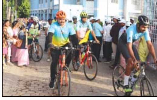
अहिल्यानगर महानगरपालिका आणि रोटरी क्लब यांच्या संयुक्त विद्यमाने शहरात जनजागृतीपर सायकल रॅलीचे आयोजन करण्यात आले होते.