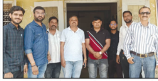
नोंदणी व मुद्रांक शुल्क विभागाच्या सहदुय्यम निबंधक अहिल्यानगर-३ या कार्यालयातील अनागोंदी कारभाराविरोधात वकिलांनी २७ जून रोजी अंतोळन केले.

नाही. यामुळे दस्त नोंदणी करणाऱ्या सर्व नागरिकांचे फोटो काळे (ब्लॅक अँड व्हाईट) येत आहेत. एवढेच नव्हे तर, शासकीय कार्यालयात प्रिंट काढण्यासाठी लागणारा लीगल कागदही संबंधित नागरिकांना बाहेरून विकत आणायला लावला जातो. कार्यालयात पिण्याच्या पाण्याचीही कोणतीही सोय नाही. नागरिकांना सुविधा देण्याची प्राथमिक जबाबदारी अधिकाऱ्यांची असताना येथे उलटाच कारभार सुरु असल्याचा संताप वकिलांनी व्यक्त केला.