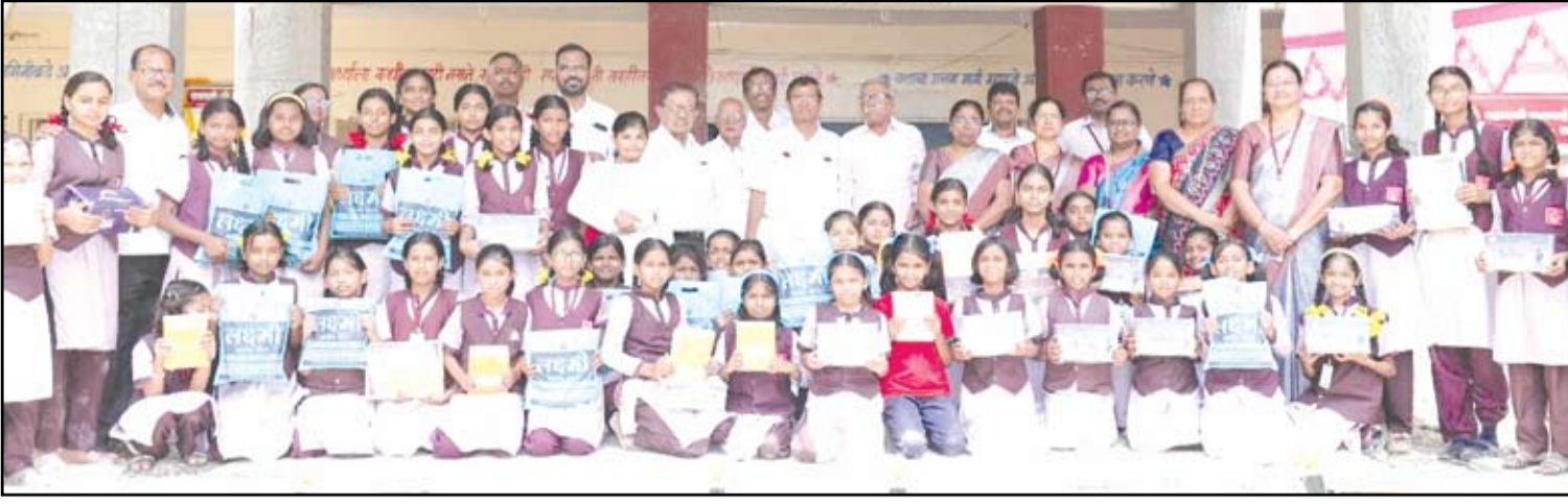
केडगाव येथील महाराणी ताराबाई कन्या विद्यालयात छत्रपती राजर्षी शाहू महाराजांची जयंती आणि सामाजिक न्याय दिन विविध समाजोपयोगी उपक्रमांनी उत्साहात साजरा करण्यात आला.