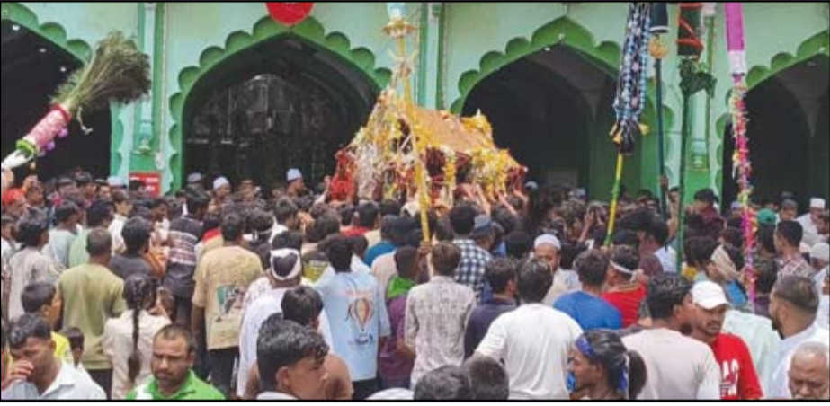
२६ जून रोजी दुपारी १२ वाजता कोठला येथून मोहम्म विसर्जन मिरवणुकीस प्रारंभ झाला.