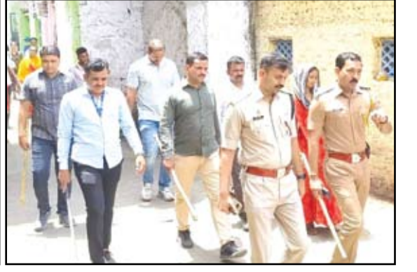
पहिल्या छायाचित्रात २५ जून रोजी रात्री मोहम्मनिमित्त निघालेल्या कत्तलची रात्र सवारी मिरवणुकीत सहभागी झालेले हजारो भाविक तर दुसऱ्या व तिसऱ्या छायाचित्रात मोहम्म विसर्जन मिरवणुकीसाठी तैनात करण्यात आलेला पोलीस बंदोबस्त.