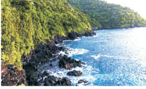
मोठ्या पावसाने प्रभावित झाले असल्याने ते अधिक संवेदनशील ठरू शकतात.

म ध्य अमेरिकेत या आठवड्यात ऐतिहासिक महापुराचा धोका निर्माण होऊ शकतो, असा इशारा हवामानशास्त्रज्ञांनी दिला आहे. सतत मुसळधार पाऊस आणि वादळे यामुळे काही भागांमध्ये मोठ्या प्रमाणात पूरस्थिती उद्भवू शकते. हवामानविषयक संकेतस्थळ अँव्यूवेदरने ईशान्य अर्कांसासपासून पश्चिम कॅटकीपर्यंतच्या भागात १,००० वर्षातील सर्वात मोठी पूरस्थिती निर्माण होण्याची शक्यता वर्तवली आहे. या भागात फक्त पाच दिवसांत चार महिन्यांच्या पावसाएवढा पाऊस पडू शकतो. यातील काही भाग आधीच