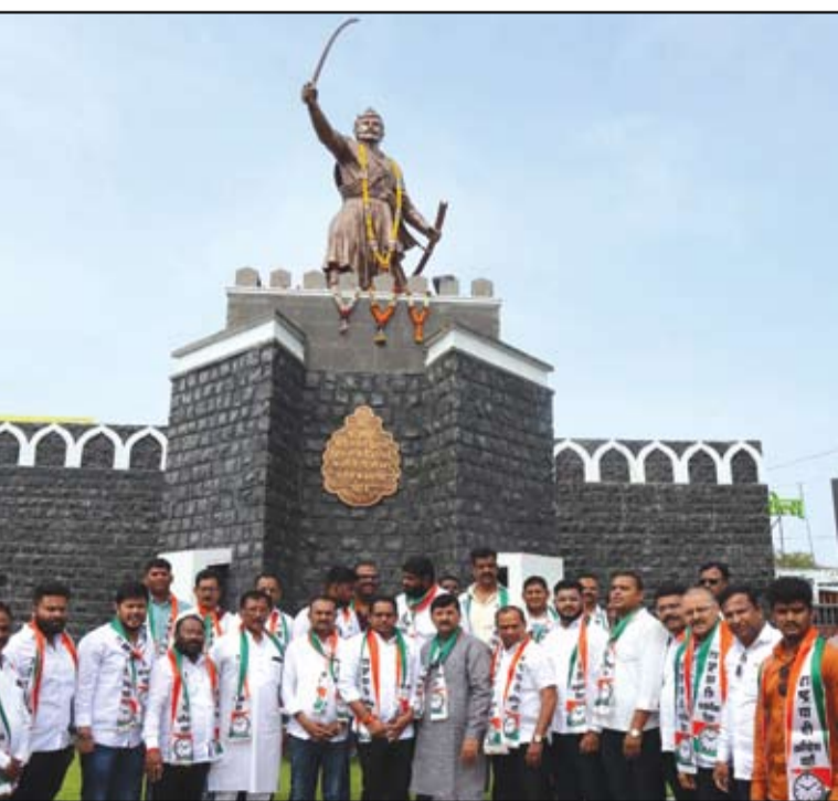
छत्रपती संभाजी महाराज यांच्या जयंतीनिमित्त राष्ट्रवादी काँग्रेस पक्षाच्या वतीने पुतळ्यास पुष्पहार अर्पण करून अभिवादन करण्यात आले.