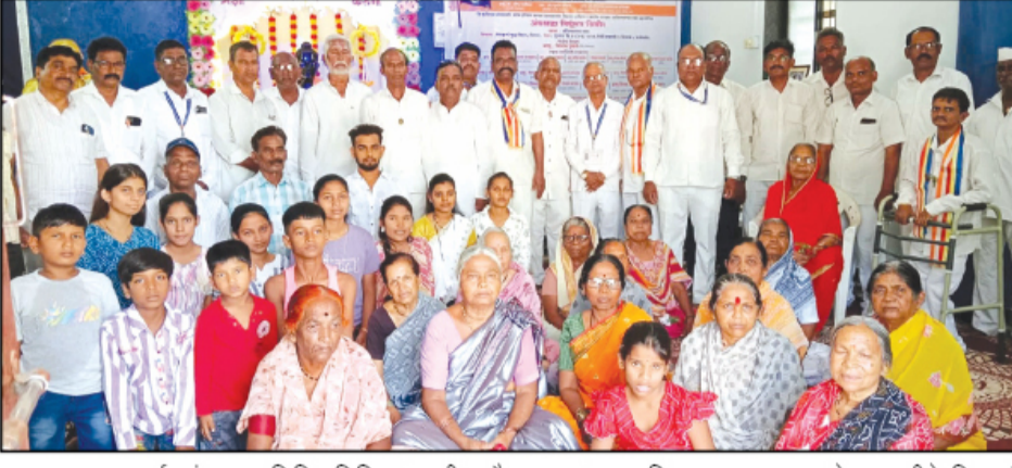
माता रमाई यांच्या स्मृतिदिनानिमित्त भारतीय बौद्ध महासभा, अहिल्यानगर शहर शाखेच्या वतीने सिद्धार्थ बुद्ध विहार, सदर बाजार, भिंगार येथे अंधश्रद्धा निर्मूलन शिबिराचे आयोजन करण्यात आले होते.