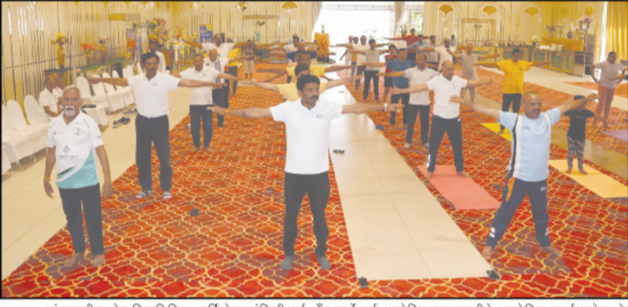
आंतरराष्ट्रीय योग दिनानिमित्त आर्किटेक्ट इंजिनीअर्स अँड सव्हेअर्स असोसिएशनच्यावतीने आयोजित कार्यशाळेत योग प्रात्यक्षिके करताना सभासद. (छाया : लहू दळवी)

नगर - आर्किटेक्ट इंजिनीअर्स अँड सव्हेअर्स असोसिएशन (एसआ) अहिल्यानगर आणि अल्ट्राटेक सिमेंट लिमिटेड यांच्या संयुक्त विद्यमाने आंतरराष्ट्रीय योग दिन उत्साहात साजरा करण्यात आला. यानिमित्त आयोजित विशेष योग कार्यशाळेत योगाविषयी माहितीपूर्ण व्याख्यान, योग प्रात्यक्षिके आणि आरोग्यविषयक मार्गदर्शन करण्यात आले. सभासद आणि त्यांच्या कुटुंबीयांनी मोठ्या उत्साहाने सहभाग नोंदवत कार्यक्रमाचा लाभ घेतला.