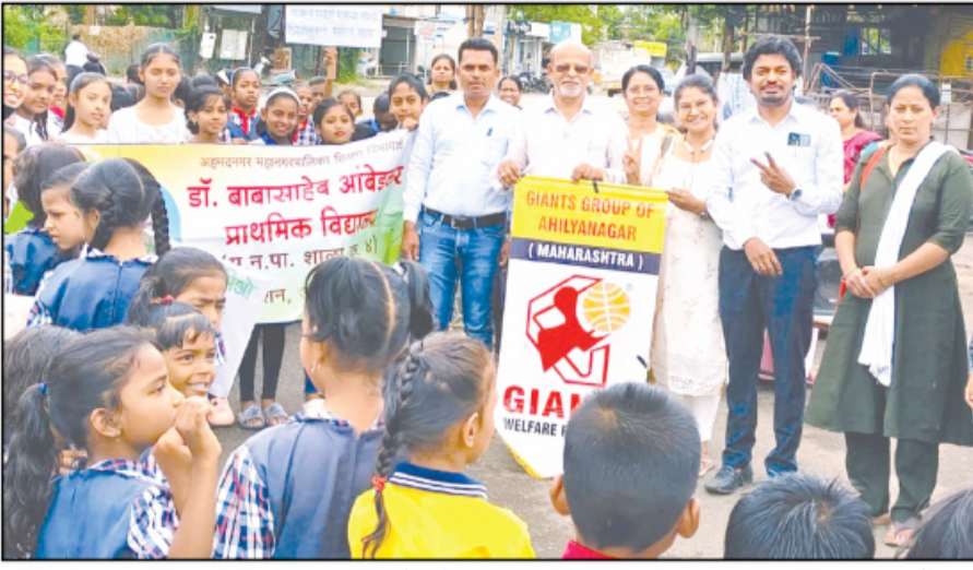
महानगरपालिका, जिजामाता प्राथमिक आरोग्य केंद्र व जायंट्स ग्रुप ऑफ अहिल्यानगर यांच्या संयुक्त विद्यमाने पल्स पोलिओ जनजागृती अभियानांतर्गत भव्य रॅली काढण्यात आली.

नगर - महानगरपालिका, जिजामाता प्राथमिक आरोग्य केंद्र व जायंट्स ग्रुप ऑफ अहिल्यानगर यांच्या संयुक्त विद्यमाने पल्स पोलिओ जनजागृती अभियानांतर्गत भव्य रॅली काढण्यात आली. २८ जून रोजी अहिल्यानगर सर्वत्र लसीकरण मोहीम राबविण्यात येणार आहे. या पार्श्वभूमीवर रॅलीद्वारे बालकांना पोलिओचा डोस पाजून समाज पोलिओमुक्त करण्याचे आवाहन करण्यात आले.