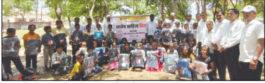
पंडित जवाहरलाल नेहरू विद्यालयात शालेय साहित्य वाटप व वृक्षारोपण करण्यात आले.

इच्छुक कलाकार व साहित्यिकांनी https://aaplesarkar.mahaonline.gov.in या संकेतस्थळावर ऑनलाइन अर्ज करावेत. अर्जदारांनी आवश्यक कागदपत्रांसह ऑनलाइन अर्ज सादर करणे आवश्यक आहे. अर्ज प्रक्रियेत अडचण आल्यास संबंधित तालुक्यातील गट विकास अधिकारी किंवा आपले सरकार सेवा केंद्राची मदत घेता येणार आहे. विपले मुदतीनंतर प्राप्त होणाऱ्या अर्जांचा विचार करण्यात येणार नाही. ऑफलाईन अर्ज स्वीकारले जाणार नसल्याचेही स्पष्ट करण्यात आले आहे.