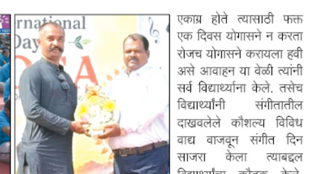
पोदार इंटरनॅशनल स्कूलमध्ये विविध योगासनाद्वारे योग दिन व संगीत दिन साजरा करण्यात आला.