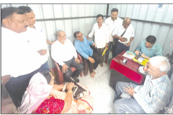
प्रवाशांच्या सोयीसाठी तसेच डिजिटल व्यवहारांना चालना देण्याच्या उद्देशाने आयोजित करण्यात आलेल्या एसटी स्मार्ट कार्ड नोंदणी शिबिराला नागरिकांचा प्रतिसाद मिळाला.