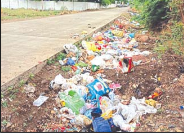
कल्याण रोड परिसरात डीपी रस्त्यांच्या कडेला साचलेले कचऱ्याचे ढिग. (छायाचित्र : लहू दळवी)

शहरातील कल्याण रोड परिसर हा झपाट्याने विकसित होत असलेला निवासी भाग आहे. या भागात मोठ्या प्रमाणात लोकवस्ती वाढत आहे. मात्र, या भागात महापालिकेच्या कचरा संकलन करणाऱ्या गाड्या वेळेवर येत नाहीत. त्यामुळे नागरिक रस्त्याकडेला कचरा टाकत असून,