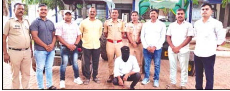
ट्रॅक्टर भाड्याने घेवून परस्पर विल्हेवाट लावणारा आरोपी जेरबंद केल्यानंतर त्याच्या समवेत एमआयडीसी पोलिसांचे पथक.