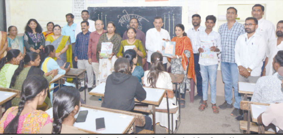
भाई सध्या नाईट हायस्कूलमध्ये शैक्षणिक वर्षाच्या पहिल्या दिवशी नव्याने प्रवेशित विद्यार्थ्यांचे स्वागत करण्यात आले.