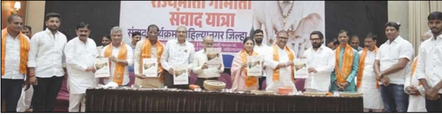
'राजमाता गोमाता संगद यात्रा'चे अहिल्यानगरमध्ये उत्साहात स्वागत करण्यात आले.