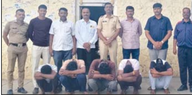
रोखड जबरदस्तीने काढून घेतली. एवढ्यावरच न थांबता आरोपींनी औटी यांना त्यांच्या गाडीत बसवून शिरूरच्या दिशेने नेले व तेथे सोडून पळ काढला. जखमी अवस्थेत औटी यांनी ११२

नगर - नगर - पुणे महामार्गावरील गव्हाणवाडी शिवारात कार चालकाला अडवून बेदम मारहाण करत तब्बल २ लाख ४७ हजार रुपयांची रोखड लुटण्याच्या टोळीचा बेलवंडी पोलिसांनी अवघ्या २ दिवसांत छडा लावत पाच आरोपींना अटक केली आहे. न्यायालयाने आरोपींना चार दिवसांची पोलीस कोठडी सुनावली आहे.