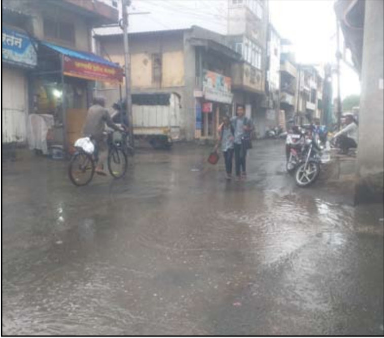
२३ जून रोजी अहिल्यानगर शहरात मान्सूनचा पाऊस पडला.