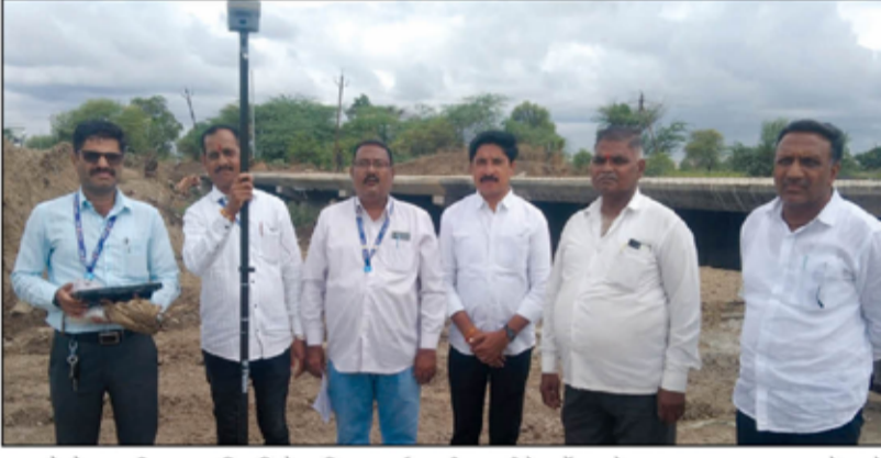
बोल्हेगाव परिसरात भूमिअभिलेख विभागामार्फत सीना नदीचे सर्वेक्षणाचे काम सुरू करण्यात आले आहे.