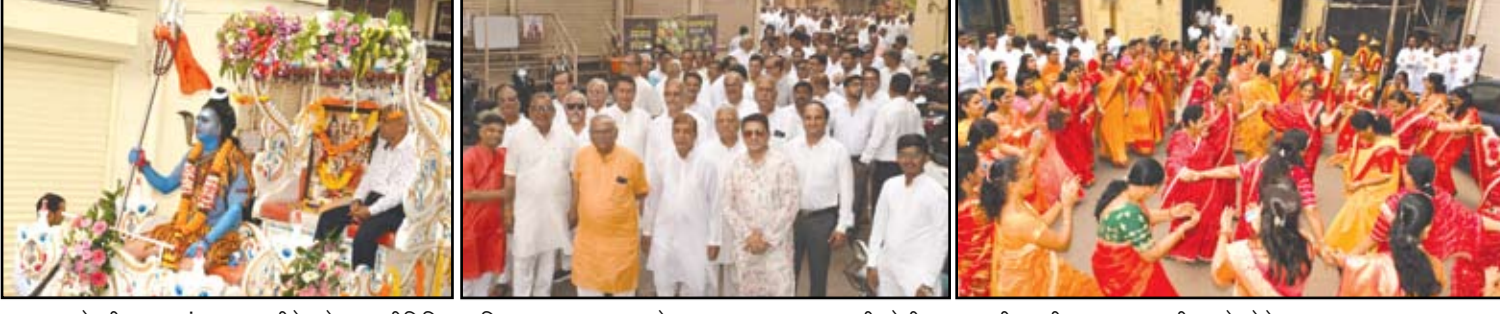
माहेश्वरी युवक मंडळाच्यावतीने महेश नवमीनिमित्त अहिल्यानगर शहरातून शोभा यात्रा काढण्यात आली होती. समाजातील स्त्री-पुरुष सहभागी झाले होते.