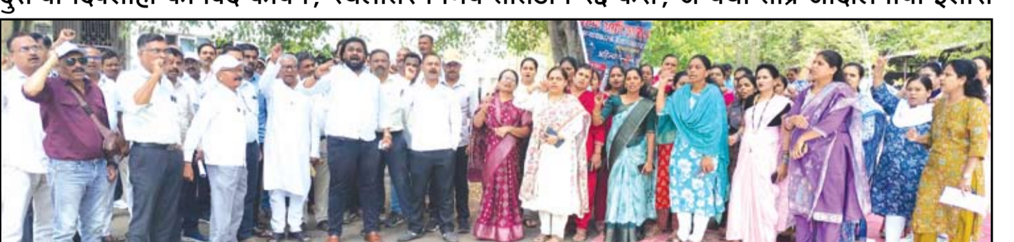
गोदावरी व कृष्णा खोरे विकास महामंडळांतर्गत शहरातील कार्यालयांच्या प्रस्तावित स्थलांतराच्या निर्णयाविरोधात मुळा पाटबंधारे जलसिंचन भवनातील कर्मचाऱ्यांचे कामबंद आंदोलन २ जून रोजी सलग दुसऱ्या दिवशीही सुरु राहिले.