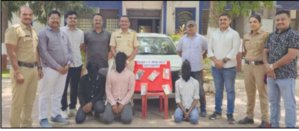
पुणे येथून बुक केलेल्या कारचालकाला बंदुकीचा धाक दाखवून लुटणारी टोळी जेरबंद केल्यानंतर त्यांच्यासमवेत एमआयडीसी पोलिसांचे पथक.