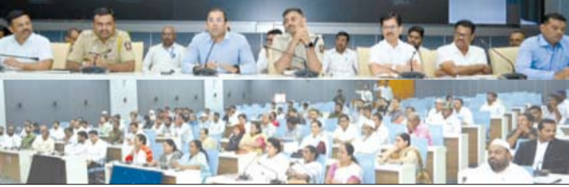
जिल्हाधिकारी कार्यालयात मोहरमच्या अनुषंगाने आयोजित जिल्हास्तरीय शांतता समितीच्या बैठकीत बोलताना जिल्हाधिकारी डॉ. पंकज आशिया.

जिल्हाधिकारी डॉ. पंकज आशिया यांचे आवाहन; जिल्हास्तरीय शांतता समितीची बैठक