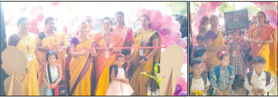
अहमदनगर एज्युकेशन सोसायटीच्या पूर्व प्राथमिक वर्ग किशोर संस्कृत संवर्धिनी विभागातील मुलांचा शाळेचा पहिला दिवस साजरा करण्यात आला.

नगर - अहमदनगर एज्युकेशन सोसायटीच्या पूर्व प्राथमिक वर्ग किशोर संस्कृत संवर्धिनी विभागातील मुलांचा शाळेचा पहिला दिवस १५ जून रोजी (प्रवेशोत्सव) साजरा करण्यात आला. पारंपारिक पध्दतीने आंब्याच्या पानांचे तोरण रांगोळी काढून तसेच विविध शैक्षणिक साधन यांनी वर्ग सजवले गेले. मुलांचे औक्षण करून व रिबिन कट करून उद्घाटन करण्यात आले. त्याचबरोबर शिक्षकांचेही औक्षण करण्यात आले. शिक्षकांनी आपापल्या वर्गातील फळक लेखन अतिशय सुंदर केले. प्रार्थना, राष्ट्रगीत व प्रतिज्ञा घेण्यात आली. छोट्या गटातील व मोठ्या गटातील मुले उपस्थित होते. छोट्या गटाची मुले लहान असल्यामुळे सुरुवातीला रडत होती