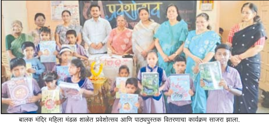
बालक मंदिर महिला मंडळ शाळेत प्रवेशोत्सव आणि पाठ्यपुस्तक वितरणचा कार्यक्रम साजरा झाला.

या नवीन हॉस्पिटलचा रुग्णांनी लाभ घ्यावा असे आवाहन करण्यात आले आहे.