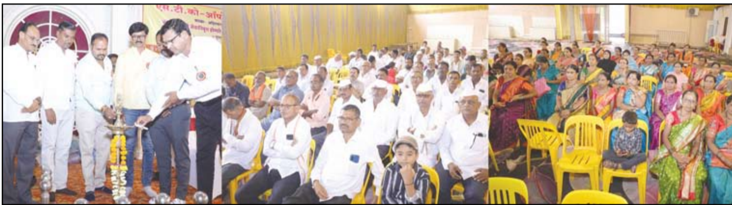
एस.टी. को-ऑप बँक लि.च्या अहिल्यानगर व श्रीरामपूर शाखेच्या संयुक्त विद्यमाने सेवापूर्ती गौरव सोहळ्याचे आयोजन करण्यात आले होते.