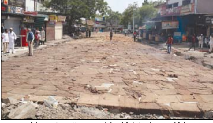
महापालिकेकडून कोठला स्टॅण्ड-फलटण पोलीस चौकी ते मंगल गेट रस्ता काँक्रीटीकरणचे काम विक्रमी वेगाने पूर्ण झाले आहे.

या रस्त्याच्या काँक्रीटीकरणामुळे परिसराला नव्या सुशोभिकरणाचे रूप प्राप्त झाले असून नागरिकांना आता प्रशस्त, मजबूत आणि सुरक्षित रस्ता उपलब्ध झाला आहे. यापूर्वी या मार्गावर वाहतुकीची कोडी, धुळीचा त्रास आणि खड्ड्यांमुळे नागरिकांना अनेक अडचणींचा सामना करावा लागत होता. मात्र आता रस्त्याचे काम पूर्ण झाल्याने वाहतुकीचा वेग वाढणार असून नागरिकांचा प्रवास अधिक सुरक्षित आणि सुलभ