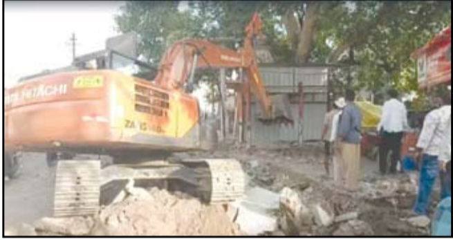
सर्जेपुरा येथील अतिक्रमणे बुलडोझर व जेसीबीने हटविताना महापालिकेचे अतिक्रमणविरोधी पथक.

पक्की रहिवासी बांधकामे, व्यापारी गाळे केली जमीनदोस्त