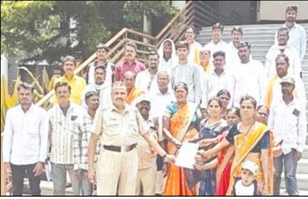
पाथर्डी तालुक्यातील डमाळवाडी, मिरा गावातील भूमिहीन आदिवासी भिल्ल समाजातील कुटुंबांना राहण्यासाठी तसेच उदरनिर्वाहासाठी शेती करण्याकरिता शासनाची जागा उपलब्ध करून द्यावी, या मागणीसाठी एकलव्य भिल्ल संघटनेच्या वतीने जिल्हाधिकार्यांना निवेदन देण्यात आले.