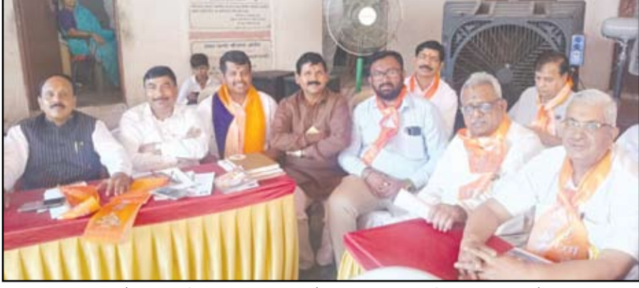
महाराष्ट्र शासनाने मगासवर्गीय समाजातील आरक्षणाचे अ-ब-क-ड उपवर्गीकरणाचा प्रस्ताव पुढे आणला असून या निर्णयाला महाराष्ट्रातील सकल चर्मकार समाजाकडून तीव्र विरोध व्यक्त करण्यात येत आहे.