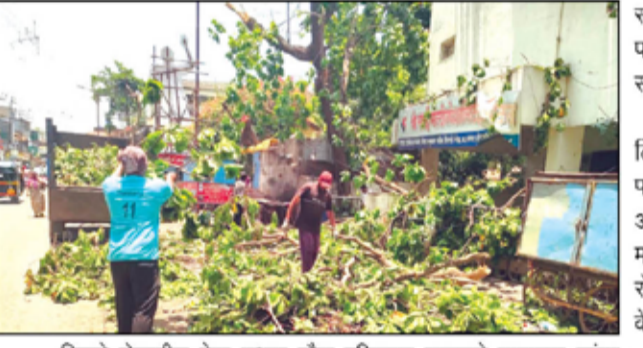
वितळे रोडवरील नेता सुभाष चौक परिसरात वादळाने झाडांच्या फांघा तुटून रस्त्यावर पडल्या होत्या. या फांघा हटविताना महापालिकेचे कर्मचारी.