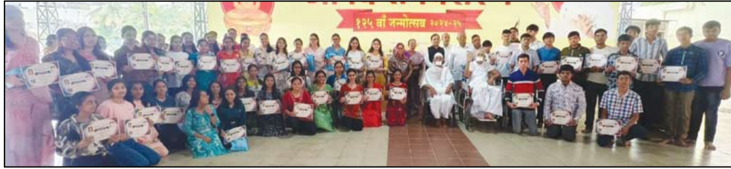
आनंदधाम येथे दहावी व बारावीच्या सकल जैन समाजाच्या गुणवंत विद्यार्थ्यांचा सत्कार समारोह व करियर गायडन्स कार्यक्रमात विद्यार्थी व पालक सहभागी झाले होते.