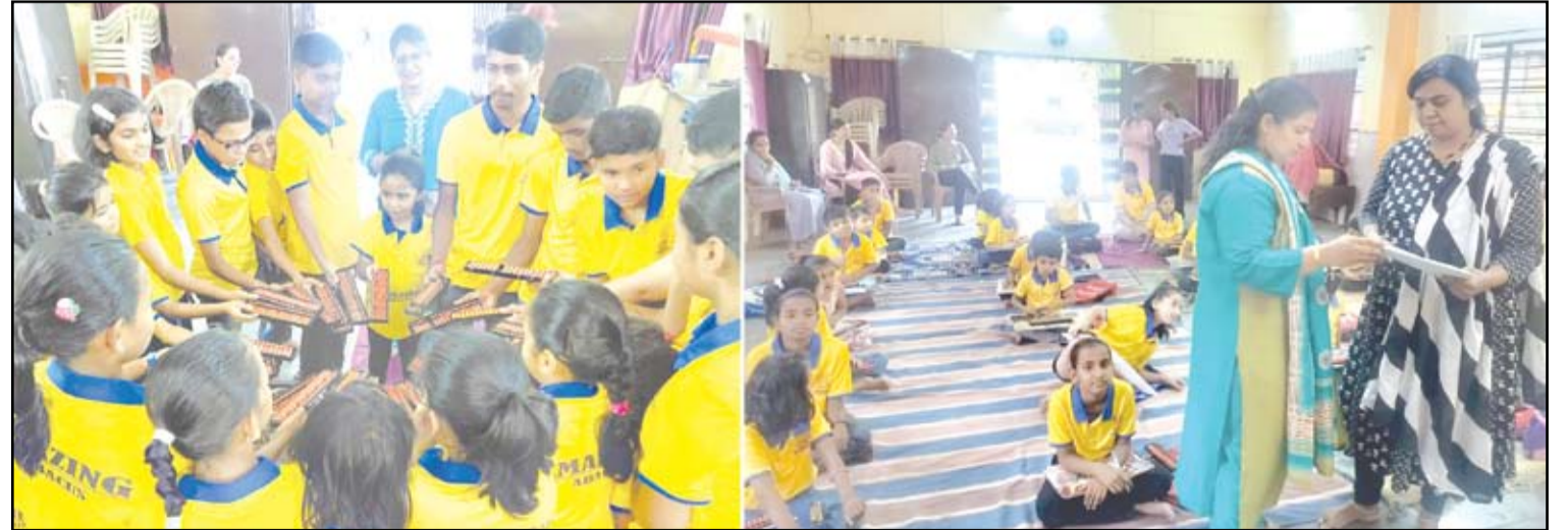
चेन्नई येथील ईसीएमएस या संस्थेने आयोजित केलेल्या अॅबॅकस ऑफलाइन इंटरनॅशनल कॉम्पिटिशनमध्ये नगरमधील अमेझिंग अॅबॅकसच्या राज्यभरातील २० शाखांमधील १३० विद्यार्थी सहभागी झाले होते.