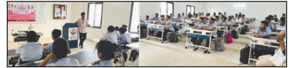
वर्धमान महावीर कॉलेज ऑफ नर्सिंग येथे थॅलेसेमिया जनजागृती कार्यक्रम झाला.

प्रार्थना, सुंदर गीते ही मुलांना शिकवली गेली. शेवटच्या दिवशी एक छोटीशी परीक्षा घेतली गेली. अनेक मुलांनी आपले विशेष प्राविण्य यात दाखवले. नगरसह बाहेरील गावातून मामा आल्या मावशीकडे आलेली बालमंडळीही शिबीरात सहभागी झाली होती. काही मुलांनी शिबीराबद्दल आपले मत व्यक्त करताना सांगितले कि आम्हाला हे शिबीर खुपच आवडले दिसत खेळत खुप काही शिकायला मिळाले. मुलांवर शिकवलेल्या गोष्टींचा परीणाम हासला. अनेक मुलांनी अन्न वाया न घालण्या, रात्रि भोजन न करणे, जंक फुड कमी करून नियमित प्रार्थना करण्याचा मानस बोलून दाखवला. आनंद संस्कार शिक्षा अभियानातील मुलांनी ताली नृत्य, व भगवान महावीरांच्या शिकवणुकीचे महत्त्व पटवून देणारे पथनाट्यसादर केले. सर्व मुलांना शिविराच्या समारोप प्रसंगी भेटवस्तू व ड्रायफूट्स देण्यात आले.