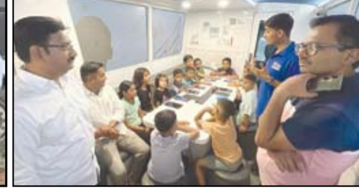
विद्यार्थ्यांच्या वैज्ञानिक दृष्टीकोनाला चालना देण्यासाठी आणि विद्यार्थ्यांच्या भविष्यास नवी दिशा देणारा 'इन्फोसिस स्पिंगबोर्ड बंगळूर' व अत्याधुनिक 'मोबाईल सायन्स लॅब' या महत्वाकांक्षी उपक्रमाचा कल्याण रोड येथील सांस्कृतिक भवन येथे शुभारंभ करण्यात आला.