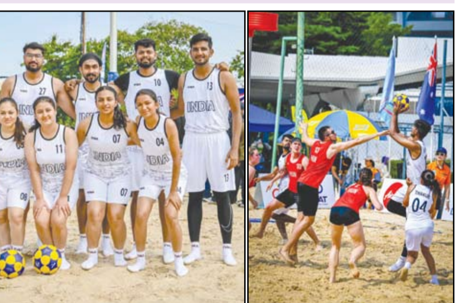
बॅकॉक, थायलंड येथे नुकत्याच पार पडलेल्या बीच कॉर्फबॉल विश्वचषक स्पर्धेत भारतीय संघाने दमदार प्रदर्शन करीत आजपर्यंतची सर्वोच्च कामगिरी करून दाखवली.