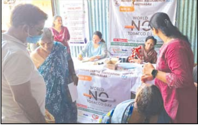
३१ मे रोजी साजरा करण्यात येणाऱ्या 'जागतिक तंबाखूमुक्त दिना' निमित्त इंडियन डेंटल असोसिएशन अहिल्यानगर शाखेच्या वतीने तंबाखूविरुधी व्यापक जनजागृती मोहीम तसेच मौखिक कर्करोग तपासणी शिबिराचे आयोजन करण्यात आले होते यामध्ये बिडी कामगार, आंध्रगिक क्षेत्रातील कामगार, माथाडी कामगार आदींची तपासणी करण्यात आली.

जागतिक आरोग्य संघटनेच्या माहितीनुसार दरवर्षी जगभरात लाखो लोकांचा मृत्यू तंबाखूजन्य पदार्थांच्या सेवनामुळे होत आहे. भारतामध्ये तोंडाचा कर्करोग हा सर्वाधिक आढळणाऱ्या कर्करोगांपैकी एक असून त्यामागील प्रमुख कारण तंबाखूचे सेवन असल्याचे