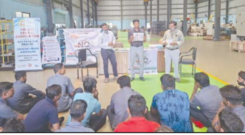
३१ मे रोजी साजरा करण्यात येणाऱ्या 'जागतिक तंबाखूमुक्त दिना' निमित्त इंडियन डेंटल असोसिएशन अहिल्यानगर शाखेच्या वतीने तंबाखूविरुधी व्यापक जनजागृती मोहीम तसेच मौखिक कर्करोग तपासणी शिबिराचे आयोजन करण्यात आले होते यामध्ये बिडी कामगार, आंध्रगिक क्षेत्रातील कामगार, माथाडी कामगार आदींची तपासणी करण्यात आली.