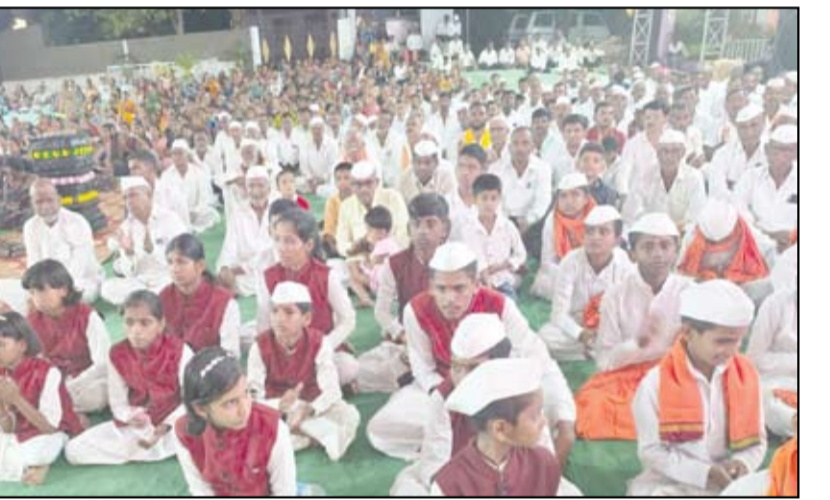
निमगाव वाघा येथे आयोजित करण्यात आलेल्या श्रीराम कथेचा नुकताच अत्यंत भक्तिमय आणि उत्साहात समारोप झाला. ९ दिवस गावात श्रीराम नामाचा गजर घुमत होता. श्री नवनाथ वारकरी शिक्षण संस्थेच्या वतीने आयोजित करण्यात आलेल्या या रामकथेला ग्रामस्थ आणि भाविकांनी उपस्थित राहून प्रतिसाद दिला.