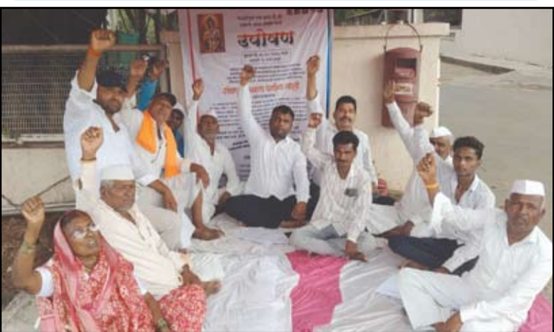
पांढरी पूल येथील औद्योगिक वसाहतीसाठी संपादित करण्यात आलेल्या जमिनीच्या मोबदल्याबाबत अन्याय झाल्याचा आरोप करत शिंगवे तुकाई येथील शेतकऱ्यांनी अहिल्यानगर येथील एमआयडीसी कार्यालयासमोर उपोषण सुरू केले आहे.

वाढीव भरपाई, नोकरी आणि प्रकल्पग्रस्त हक्कांसाठी आंदोलन