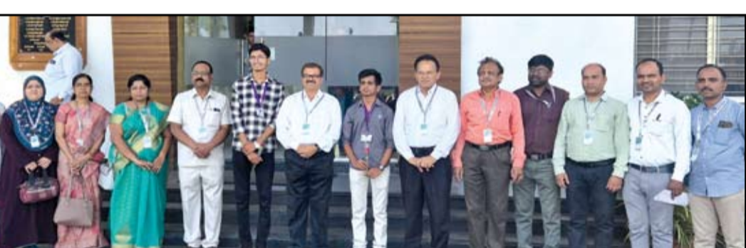
स्पर्धा परीक्षेत यश मिळविलेल्या न्यू आर्ट्स महाविद्यालयाच्या रसायनशास्त्र विभागातील विद्यार्थी.

नगर - अहमदनगर जिल्हा मराठा विद्या प्रसारक समाज संस्थेचे न्यू आर्ट्स, कॉमर्स अँड सायन्स महाविद्यालयाच्या रसायनशास्त्र विभागातील विद्यार्थ्यांनी शैक्षणिक वर्ष २०२५-२०२६ मध्ये विविध देशपातळीवर आणि राज्य पातळीवर घेतल्या जाणाऱ्या स्पर्धा परीक्षांमधून घवघवीत यश संपादन केले आहे.