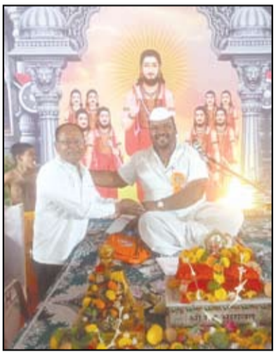
निमगाव वाघा येथे आयोजित करण्यात आलेल्या श्रीराम कथेचा नुकताच अत्यंत भक्तिमय आणि उत्साहात समारोप झाला. ९ दिवस गावात श्रीराम नामाचा गजर घुमत होता. श्री नवनाथ वारकरी शिक्षण संस्थेच्या वतीने आयोजित करण्यात आलेल्या या रामकथेला ग्रामस्थ आणि भाविकांनी उपस्थित राहून प्रतिसाद दिला.

रामकथेच्या यशस्वी आयोजनासाठी श्री नवनाथ वारकरी शिक्षण संस्थेतील विद्यार्थी, शिक्षक, ग्रामस्थ आणि युवकांनी परिश्रम घेतले.