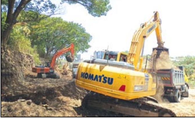
सीना नदीपात्रात रुंदीकरण व खोलीकरणाचे काम सुरु आहे.

नगर - शहरातून वाहणाऱ्या सीना नदीचे पात्र विस्तारित करण्यासाठी प्रशासनाने जोरदार मोहीम हाती घेतली असून, पुराचा धोका कमी करण्याच्या दृष्टीने नदीचे रुंदीकरण आणि खोलीकरण युद्धपातळीवर सुरु आहे. बुरुडगाव येथील बाबरमळा ते स्टेशन रोडवरील लोखंडी पुलापर्यंतच्या सुमारे तीन किलोमीटर अंतरात हे काम सुरु असून, यासाठी राज्य शासनाकडून २० कोटी रुपयांचा निधी मंजूर करण्यात आला आहे.