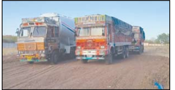
शहरात प्रवेश करणाऱ्या वाहनांना अडवून शहराबाहेरच थांबवण्यात येत आहे.