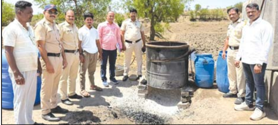
नगर तालुक्यातील निमागाव घाणा आणि टाकळी खातगाव परिसरात गावठी दारू अड्ड्यांवर छापा टाकून कारवाई करताना एमआयडीसी पोलीसांचे पथक.