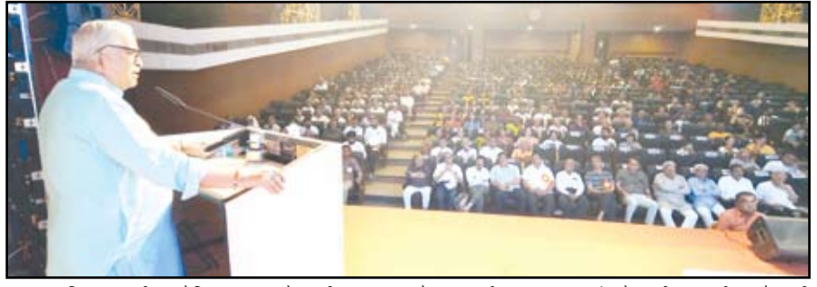
विचार भारती आयोजित ग. म. मुळे स्मृती व्याख्यानमालेच्या चतुर्थ पुण्यात रा.स्व.संघाचे माजी सरकार्यवाह भैय्याजी जोशी यांनी उपस्थिताना मार्गदर्शन केले.

नगर - हजारो वर्षांपासून हिंदू समाज हा प्रगत आणि वैभवशाली परंपरा जपणारा समाज म्हणून अस्तित्वात आहे. काळानुरूप बदल स्वीकारत भारताने अनेक संकटांवर मात करत जगात आपले स्वतंत्र स्थान निर्माण केले आहे. भविष्यकाळात भारताचा गौरव वाढवणारा, संस्कारित व जबाबदार समाज निर्माण करणे ही काळाची गरज आहे. यासाठी भारताचा आधार असलेल्या कुटुंब व्यवस्थेला सशक्त करणे, प्रकृतीला केवळ वंदन न करता तिच्या संरक्षण आणि संवर्धनाची जबाबदारी घेणे, देशासंबंधी सर्व कर्तव्य पार पडावेत, असे प्रतिपादन रा.स्व.संघाचे माजी सरकार्यवाह भैय्याजी जोशी यांनी केले.