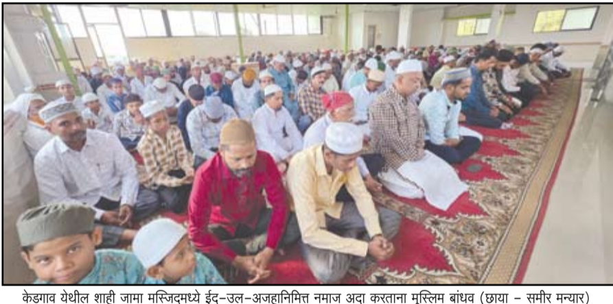
केडगाव येथील शाही जामा मस्जिदमध्ये ईद-उल-अजहानिमित्त नमाज अदा करताना मुस्लिम बांधव

पोलीस प्रशासनाच्या वतीने खबरदारी म्हणून ईदगाह मैदानसह शहरातील चौका-चौकात पोलीस बंदोबस्त ठेवण्यात आला होता. कोठला येथून जाणारी वाहवूक दुसऱ्या मार्गाने वळविण्यात आली होती. नमाजानंतर शहरातील विविध कब्रस्तान व दर्गांमध्ये भाविकांनी दर्शनासाठी गर्दी केली होती. बकरी ईद निमित्त तीन दिवस म्हणजे गुरुवार पासून शनिवार पर्यंत घरोघरी कुर्बानी केली जाणार आहे.