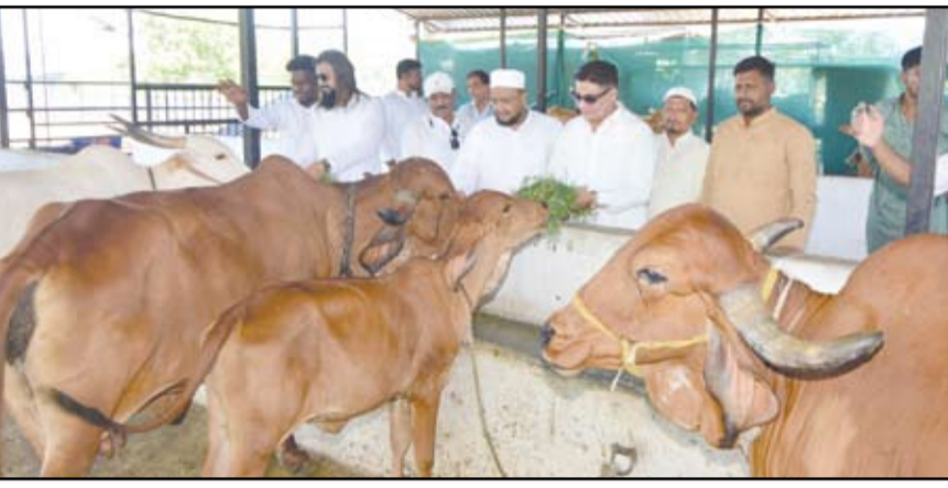
आय लव्ह अहमदनगर फाऊंडेशनच्या वतीने सतनाम साक्षी गोशाळेत चारा वाटप करण्यात आला.

नगर - बकरी ईद (ईद-उल-अजहा) या पवित्र सणानिमित्त शहरात धार्मिक एकात्मता, सामाजिक सलोखा आणि मानवतेचा अनोखा संदेश देणारा उपक्रम २८ मे रोजी पार पडला. मुस्लिम समाजातील युवकांनी ईदच्या नमाजानंतर थेट गोशाळेत जाऊन गाईंना चारा वाटप करत समाजासमोर बंधुभावाचे एक वेगळे उदाहरण उभे केले. या उपक्रमामुळे अनेकांच्या भुवया उंचावल्या असून, धर्म वेगळे असले तरी माणुसकी एकच असते, हा संदेश देण्यात आला.