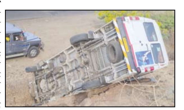
साकत घाटात खड्ड्यात पलटी झालेली मिनी ट्रॅव्हल बस.

जामखेड - औदा नागनाथ वरून जेजुरी पुण्याकडे जात असलेल्या भाविकांच्या मिनी ट्रॅव्हल बसला जामखेड तालुक्यातील साकत घाटात २७ मे रोजी पहाटे २ वाजेच्या सुमारास भीषण अपघात झाला. या अपघातात ४ जण गंभीर जखमी झाले असून इतर १८ ते २० जण किरकोळ जखमी झाले आहेत.