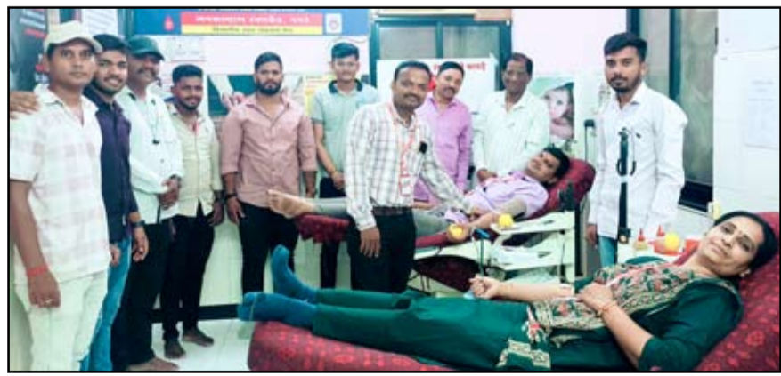
जनकल्याण रक्तकेंद्राच्या वतीने आयोजित शिबिरात रक्तदान करताना दाते.