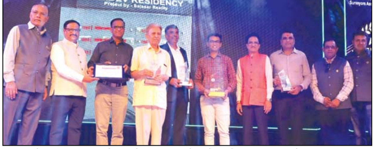
आर्किटेक्ट इंजिनीअर्स अॅण्ड सर्व्हिसेस असोसिएशन (एसा) तर्फे आयोजित 'बेस्ट स्ट्रक्चर अवॉर्ड' सोहळ्यात अहिल्यानगरमधील निलेश कन्स्ट्रॉटेक फर्मचा विशेष सन्मान करण्यात आला.