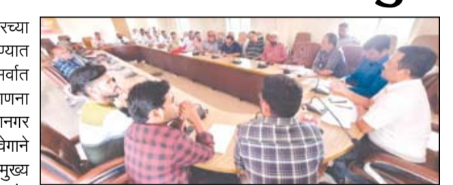
अहिल्यानगर महापालिका क्षेत्रात 'डिजिटल जनगणनेबाबत आयोजित बैठक.