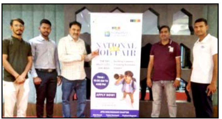
जितो नॅशनल जॉब फेअर २०२६ ला देशभरातील युवा वर्गाचा प्रतिसाद मिळाला.

नगर - जैन इंटरनॅशनल ट्रेड ऑर्गनायझेशनच्यावतीने (जितो) रोजगार निर्मिती, युवक सक्षमीकरण आणि उद्योग क्षेत्राला सक्षम मनुष्यबळ उपलब्ध करून देण्याच्या उद्देशाने २३ मे रोजी पॅन इंडिया जितो नॅशनल जॉब फेअर २०२६ चे आयोजन करण्यात आले. देशभरातील विविध जितो चॅप्टर्समध्ये एकाच दिवशी आयोजित करण्यात आलेल्या या उपक्रमाला युवक, उद्योग समूह आणि कंपन्यांकडून प्रतिसाद लाभला. या राष्ट्रीय उपक्रमाचा एक भाग म्हणून जितो अहिल्यानगर चॅप्टरने २३ मे रोजी अहिल्यानगर येथे अर्थ ७ बँकेत, जीसीएम टॉवर्स येथे जॉब फेअरचे आयोजन करण्यात आले. या जॉब फेअरमध्ये मॅन्युफॅक्चरिंग, ऑटोमोबाईल, फायनान्स, बँकिंग, मार्केटिंग, प्रशासन, तांत्रिक क्षेत्र तसेच विविध उद्योग क्षेत्रातील नामांकित कंपन्यांनी सहभाग घेत उमेदवारांच्या मुलाखती घेतल्या. अहिल्यानगर येथे आयोजित जॉब फेअरमध्ये १० पेक्षा अधिक कंपन्यांचा सहभाग असून ६५ पेक्षा अधिक उमेदवारांनी ऑनलाईन व ऑफलाईन नोंदणी केली. त्यापैकी १५ उमेदवारांची ऑन-द-स्पॉट शॉर्टलिस्टिंग करण्यात आली असून ३० पेक्षा अधिक उमेदवारांची