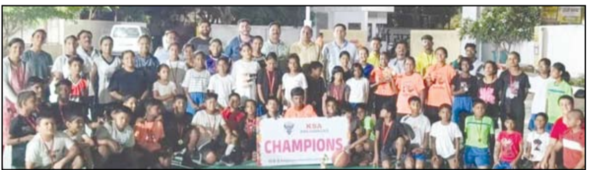
ऊर्जा गुरुकुल स्कूलमध्ये रंगीत स्पर्धा सन्मानचिन्ह देऊन गौरविण्यात आले.

विजेत्या संघांना पारितोषिके व सन्मानचिन्ह देऊन गौरविण्यात आले.