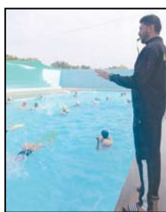
आठरे पाटील पब्लिक स्कूलच्या अत्याधुनिक जलतरणास नगरकरांचा प्रतिसाद लाभत आहे.

नगर - शहराच्या सावेडी भागातील वडगांव-गुसा रोडवरील, आठरे पाटील पब्लिक स्कूल या इंग्रजी माध्यमाच्या वसतिगृहात्मक शाळेचा अद्ययावत जलतरण तलाव विद्यार्थ्यांसाठी तयार केलेला असून पश्चिम महाराष्ट्रातील फ्रेंच तंत्रज्ञानावर आधारित हा एकमेव जलतरण तलाव आहे. जलतरण तलावासह शॉवर रुम, बाथरूम, लाईफगार्ड, चेंजिंग रुम मुलां- मुलींसाठी स्वतंत्र सुविधा उपलब्ध आहेत. देज वायो पूल्स या फ्रेंच कंपनीने