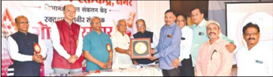
विहिंचचे मंदिर अर्चक पुरोहित आयामाचा रक्तदानाचा गौरव पुरस्काराने विशेष सन्मान करण्यात आला.