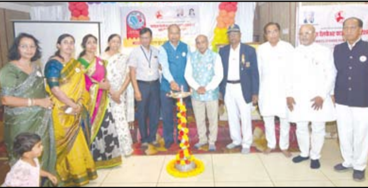
जायंटस् वेलफेअर फाउंडेशन फेडरेशन 2B ची द्वितीय कौन्सिल मीटिंग व सहेली सिम्पोजियम शहरात उत्साहात पार पडले. फेडरेशन कौन्सिलच्या सर्व पदाधिकाऱ्यांसह राज्यभरातील महिला प्रतिनिधींनी उपस्थिती लावत सामाजिक क्षेत्रात करण्यात आलेल्या कार्याचा आढावा घेतला.

सहेली सिम्पोजियममधून महिला सक्षमीकरण, बचत आणि निरोगी जीवनशैलीचा संदेश, राज्यभरातील प्रतिनिधींची उपस्थिती; सामाजिक कार्याचा आढावा