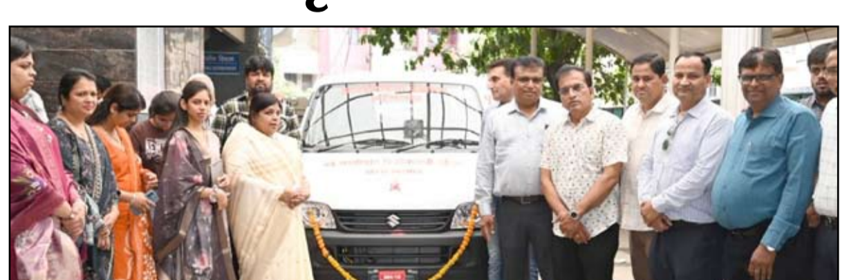
आनंदऋषीजी नेत्रालयास शेट्टीया परीवाराच्यावतीने मोबाईल अॅम्बुलन्स व्हॅनचा लोकार्पण सोहळा पार पडला.