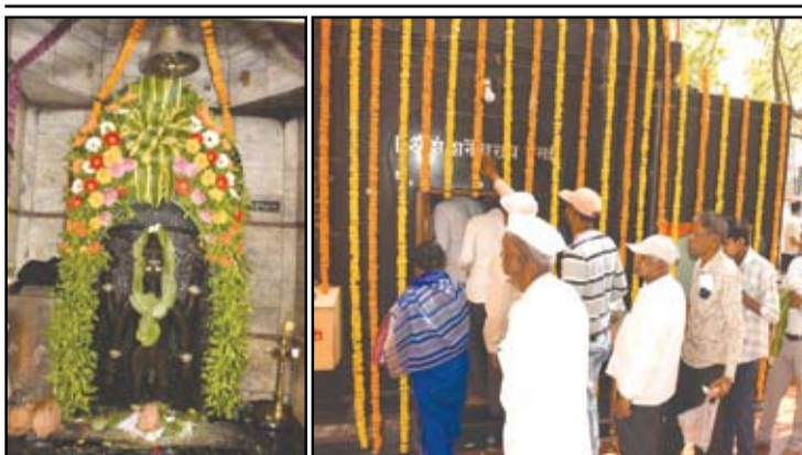
शनि जयंती, अमावस्या आणि शनिवार अत्यंत पवित्र योग यंदा एकाच दिवशी आल्याने शहरातील माळीवाडा येथील शनि मारुती मंदिर परिसरात विविध धार्मिक कार्यक्रमांचे आयोजन केले होते. माळीवाडा पंच मंडळ देवस्थान ट्रस्टच्या वतीने भाविकांसाठी विशेष सुविधा उपलब्ध करून देण्यात आल्या. तसेच यावेळी भाविकांनी दर्शनासाठी गर्दी केली होती.