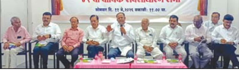
स्व. यशवंतराव चव्हाण समता सहकार सभागृहात झालेल्या सभेत संस्थेच्या आर्थिक प्रगतीचा ताळेबंद व नफातोटा पत्रक मांडण्यात आले. यावेळी सर्व सभासदांनी सर्व ठराव हात वर करून मंजूर करण्यात आले.

दाखवले. त्यांनी सांगितले की, अत्याधुनिक तंत्रज्ञानामुळे समताने राज्यात वेगळी ओळख निर्माण केली आहे.