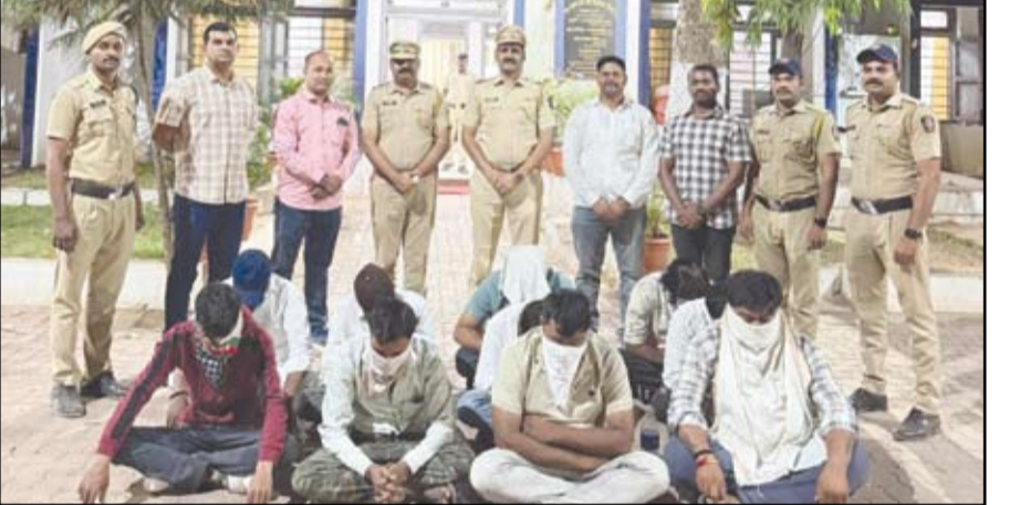
बंद पडलेल्या कचरा डेपोतील जुगार अड्ड्यावर छापा टाकून पकडलेल्या आरोपींसमवेत एमआयडीसी पोलीसांचे पथक.