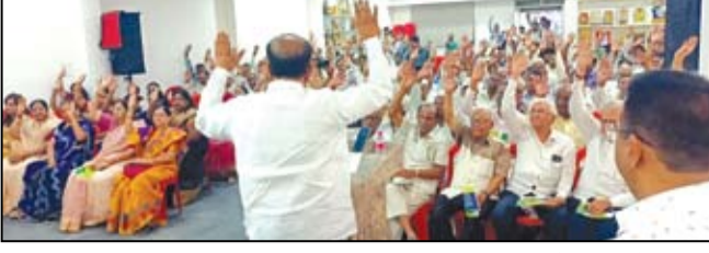
स्व. यशवंतराव चव्हाण समता सहकार सभागृहात झालेल्या सभेत संस्थेच्या आर्थिक प्रगतीचा ताळेबंद व नफातोटा पत्रक मांडण्यात आले. यावेळी सर्व सभासदांनी सर्व ठराव हात वर करून मंजूर करण्यात आले.