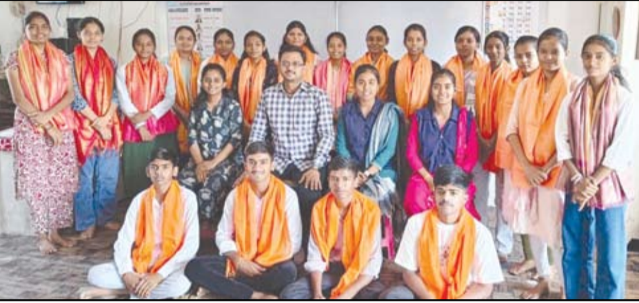
दहावी बोर्डाच्या परिक्षेत यशस्वी झालेले ज्ञानसाधना गुरुकुलचे विद्यार्थी.