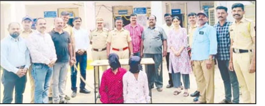
रेल्वे स्थानकात प्रवाशांचे मोबाईल चोरणारे दोघांना २ तासांत पकडल्यानंतर त्यांच्यासमवेत रेल्वे पोलीसांचे पथक.