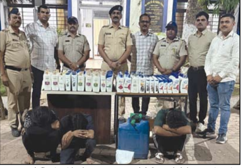
नगरमध्ये ब्रँड कंपन्यांची नावे वापरून बनावट शाम्पूची विक्री करणारी टोळी पकडल्यानंतर त्यांच्या समवेत एमआयडीसी पोलीसांचे पथक.

पोलीसांनी परप्रांतीय टोळीला ठोकल्या बेड्या, १ लाखाचा मुद्देमाल जप्त