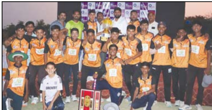
अहिल्यानगर प्रीमियर लीगमध्ये जी एन एस नाईट रायडर्स विजेता, अहिल्यानगर सुपर किंग उपविजेता ठरला.

१११ धावांच्या आव्हानाचा पाठलाग करताना अहिल्यानगर सुपर किंग संघानेही लढत दिली. शेवटच्या षटकात विजयासाठी ११ धावांची गरज असताना सामन्याने रंगत घेतली.