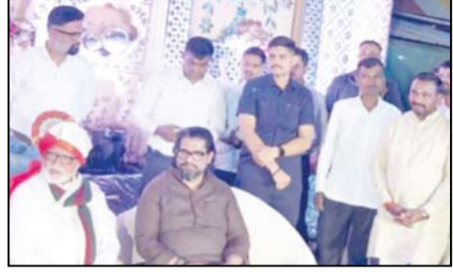
अहिल्यानगर येथे आयोजित कार्यक्रमानिमित्त अन्न, नागरी पुरवठा आणि ग्राहक संरक्षण मंत्री छगन भुजबळ यांचे व सार्वजनिक बांधकाम मंत्री शिवेंद्रसिंहराजे भोसले यांचे स्वागत करण्यात आले.

छगनराव भुजबळ यांनी आपल्या भाषणात महाराष्ट्राच्या