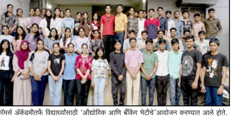
एफसीए कॉमर्स अॅकॅडमीतर्फे विद्यार्थ्यांसाठी 'औद्योगिक आणि बँकिंग भेटीचे' आयोजन करण्यात आले होते.