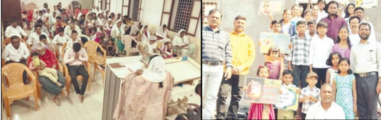
गुडफ्रायडे निमित्त आयोजित उपासनेत वधस्तंभावरील सात शब्दावर संदेश देण्यात आला. तसेच रेटणे गुंजाळ येथे इस्टर संडे निमित्त तरण संघ व संडे स्कूल च्या मुलांनी फेरी काढली.