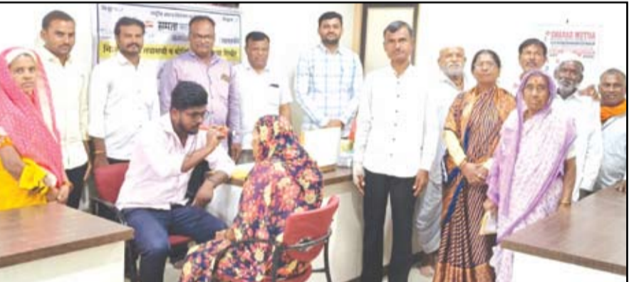
नेसी येथे राष्ट्रीय अंधत्व नियंत्रण कार्यक्रमांतर्गत समता फाउंडेशन, एच. व्ही. देसाई नेत्र रुग्णालय, पुणे व ग्रामपंचायत कार्यालय, नेसी यांच्या संयुक्त विद्यमाने आयोजित करण्यात आलेल्या निःशुल्क नेत्र तपासणी व मोतीबिंदू शस्त्रक्रिया शिबिरास नागरिकांचा प्रतिसाद मिळाला.

नगर - नगर तालुक्यातील नेसी येथे राष्ट्रीय अंधत्व नियंत्रण कार्यक्रमांतर्गत समता फाउंडेशन, एच. व्ही. देसाई नेत्र रुग्णालय, पुणे व ग्रामपंचायत कार्यालय, नेसी यांच्या संयुक्त विद्यमाने आयोजित करण्यात आलेल्या निःशुल्क नेत्र तपासणी व मोतीबिंदू शस्त्रक्रिया शिबिरास नागरिकांचा प्रतिसाद मिळाला. सकाळी १० ते दुपारी १ वा वेळेत पार पडलेल्या या शिबिरात रुग्णांनी नेत्र तपासणी करून घेतली.