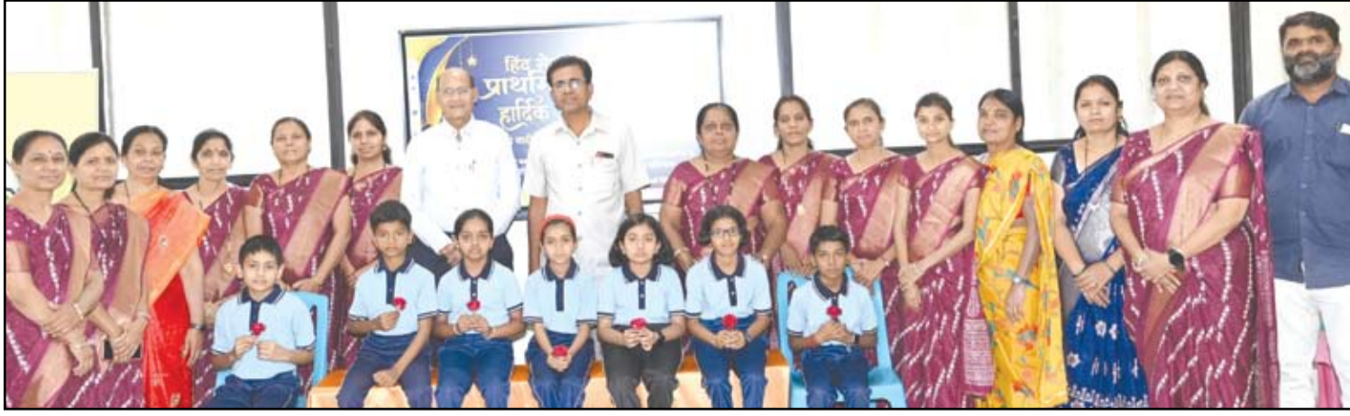
हिंद सेवा मंडळाची प्राथमिक शाळा, बागडपट्टी विभागाचे इयत्ता चौथीतील ७ विद्यार्थी डॉ. हेगडेवार शिक्षण प्रतिष्ठान आयोजित अहिल्यानगर प्रज्ञाशोध परिक्षेत जिल्हास्तर गुणवत्ता यादीत चमकले.