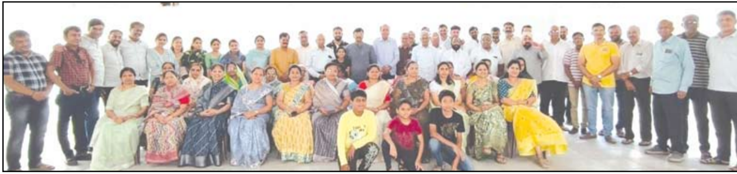
प्रभाग क्रमांक १४ मधील नवनिर्वाचित नगरसेवकांचा एमएसईबी माणिकनगर परिसरातील रहिवाशांच्या वतीने सत्कार करण्यात आला.