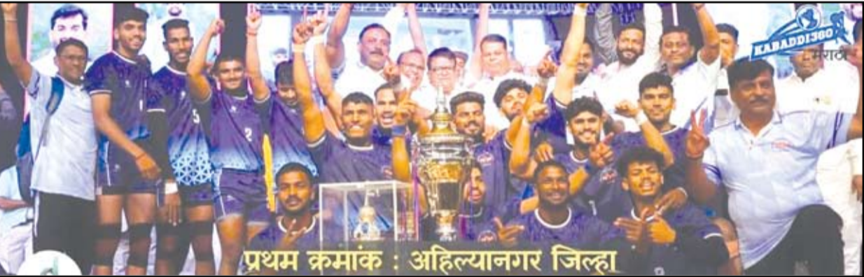
प्रथम क्रमांक : अहिल्यानगर जिल्हा