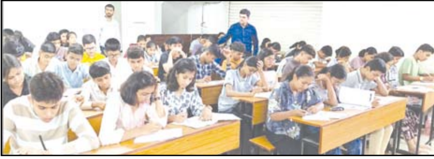
श्री सांदिपनी अकॅडमीतर्फे आयोजित 'निश्चय' परीक्षेला विद्यार्थ्यांचा प्रतिसाद मिळाला.

नगर - शहरातील शैक्षणिक संस्था श्री सांदिपनी अकॅडमीच्या वतीने आयोजित 'निश्चय २०२६' (Entrance cum Scholarship Exam) या राज्यस्तरीय प्रवेश व शिष्यवृत्ती परीक्षेला विद्यार्थ्यांचा अभूतपूर्व प्रतिसाद मिळाला. ५ एप्रिल रोजी एकविरा चौक येथील आयआयटी-जेईई कॅम्पसमध्ये पार पडलेल्या या परीक्षेत इयत्ता ६ वी ते १०वी मधील ५०० पेक्षा जास्त विद्यार्थ्यांनी सहभाग नोंदवला.