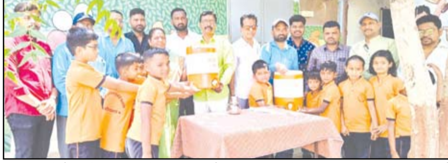
जय जिद्धेश्वर प्रतिष्ठान ट्रस्ट, अहिल्यानगर या संस्थेचा १२ वा वर्धापन दिन साजरा करण्यात आला. ट्रस्टच्या वतीने संस्कृती श्रीनिवास कनोरे प्रशाला येथील विद्यार्थ्यांसाठी पिण्याच्या पाण्याचे जार भेट देण्यात आले.

सोहळ्यास भाविकांची उपस्थिती होती. टाळ-मृदंगाच्या गजरात, अमंग-कीर्तनाच्या सुरावटीत आणि हरिनामाच्या जयघोषात संपूर्ण परिसर भक्तिमय वातावरणात न्हाऊन निघाला.