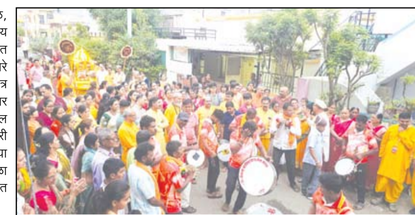
केडगाव च्या वैष्णवनगर मध्ये चैत्र पौर्णिमेनिमित्त काढण्यात आलेल्या योगेश्वरी देवीच्या पालखी सोहळ्यात सहभागी झालेले भाविक.

नगर - दाटलेले आभाळ, रिमझिमगारा पाऊस व त्यात जय जगदंबाच्या अखंड नाम गजरात वाद्याच्या ठेक्यावर ताल धरून नाचणारे भक्तगण. हे औचित्य होते ते चैत्र पौर्णिमेनिमित्त केडगाव च्या वैष्णवनगर मध्ये हरिद्वार च्या शांतिकुंज अखिल विश्व गायत्री परिवाराच्या वतीने योगेश्वरी देवीच्या मंदिरात आयोजित केलेल्या तीन दिवसीय उत्सवाचे. हा सोहळा १ ते ३ एप्रिल असा साजरा करण्यात आला.