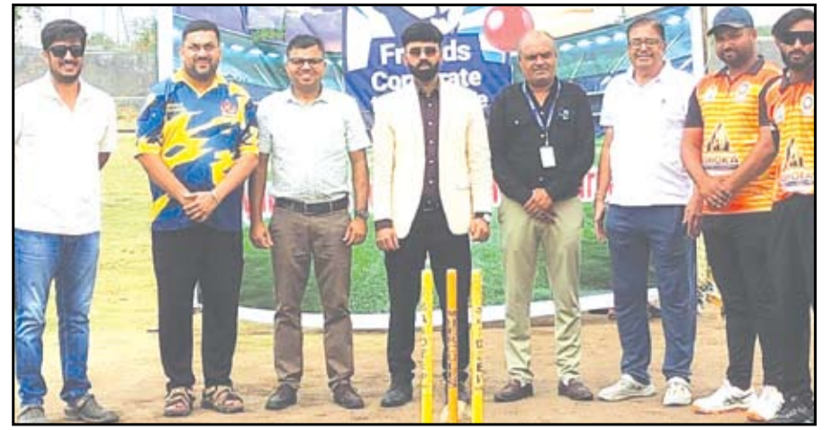
फ्रेंड्स कॉर्पोरेट टी-२० क्रिकेट लीगचे उद्घाटन करण्यात आले.

ही परीक्षा यशस्वी करण्यासाठी श्री सांदिपनी अकॅडमीच्या शिक्षक आणि कर्मचारी वृंदाने परिश्रम घेतले. परीक्षेचा निकाल लवकरच जाहीर होणार असून, अधिक माहितीसाठी अकॅडमीच्या कार्यालयात संपर्क साधावा, असेही संस्थेमार्फत कळवण्यात आले आहे.