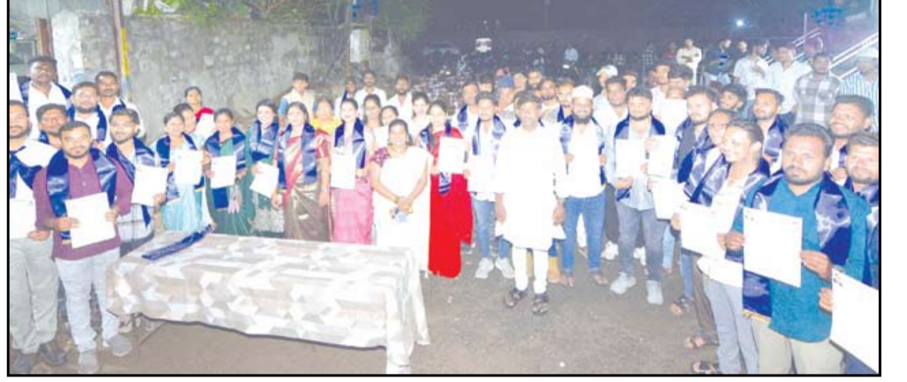
रिपब्लिकन पार्टी ऑफ इंडिया (गवई) पक्षाची बैठक नुकतीच पार पडली. या बैठकीत शहराची नवीन कार्यकारिणी जाहीर करण्यात आली.

लवकरच जिल्हाव्यापी मेळावा; राहुरी विधानसभा निवडणुकीत उमेदवार देण्याचे संकेत