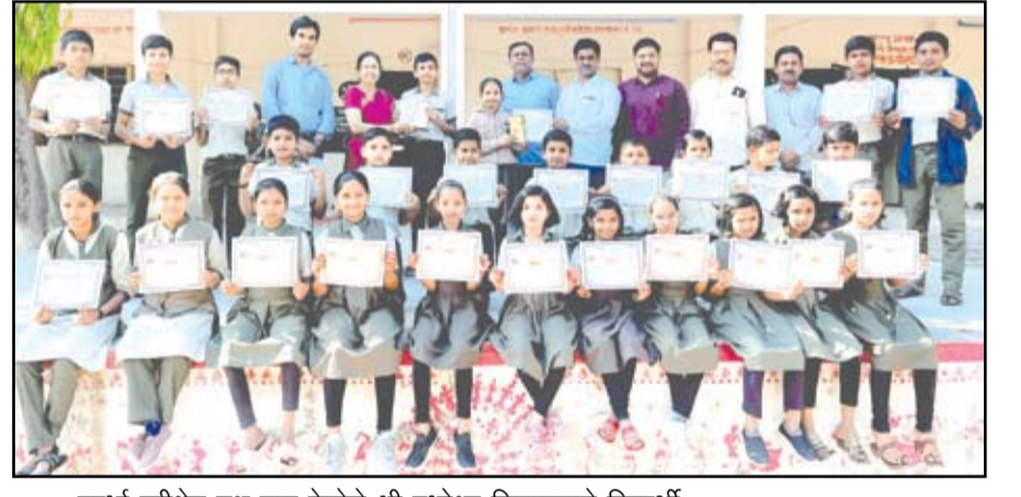
स्पर्धा परीक्षेत यश प्राप्त केलेले श्री वृध्देश्वर विद्यालयाचे विद्यार्थी.