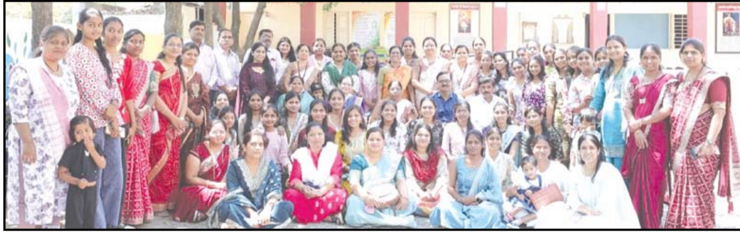
केडगाव येथील महाराणी ताराबाई कन्या विद्यालयात आयोजित करण्यात आलेला माजी विद्यार्थिनी मेळावा उत्साहपूर्ण आणि भावनिक वातावरणात पार पडला.