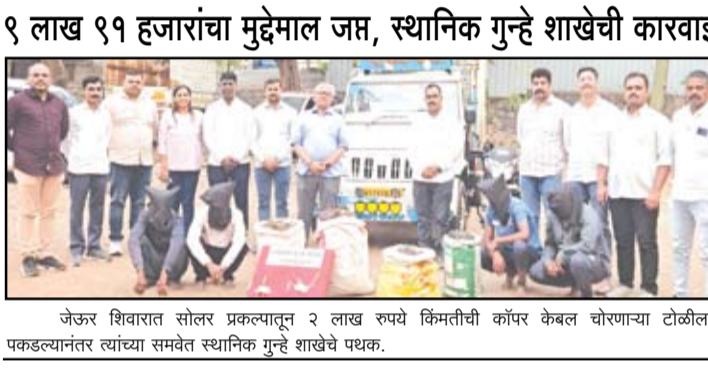
जेऊर शिवारात सोलर प्रकल्पातून २ लाख रुपये किंमतीची कॉपर केबल चोरणाऱ्या टोळीला पकडल्यानंतर त्यांच्या समवेत स्थानिक गुन्हे शाखेचे पथक.

नगर - नगर तालुक्यातील जेऊर शिवारात घुस्ती डोंगरावर असलेल्या अवादा कंपनीच्या सोलर प्रकल्पातून २ लाख रुपये किंमतीची कॉपर केबल चोरून नेणाऱ्या रेकॉर्ड वरील सराईत गुन्हेगारांच्या टोळीला स्थानिक गुन्हे शाखेच्या पथकाने शेंडी बायपास रोडवर सापळा लावून पकडले आहे. या टोळीकडून चोरीचे ३ गुन्हे उघडकीस आले असून पोलिसांनी त्यांच्या कडून ९ लाख ९१ हजार ५०० रुपयांचा मुद्देमाल हस्तगत केला आहे.