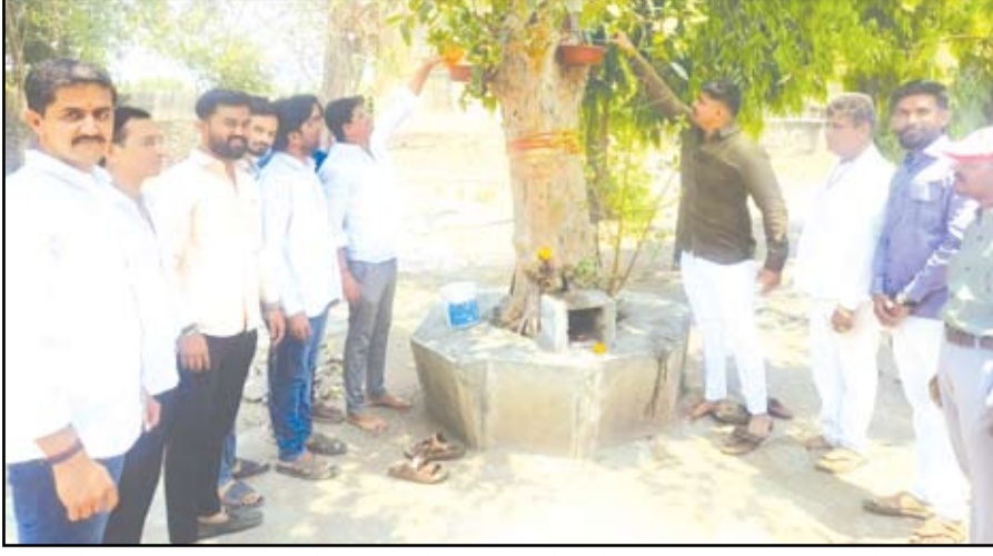
मोरया युवा प्रतिष्ठानच्या वतीने सिद्धिबाग येथील श्री सिध्देश्वर देवस्थान परिसरात कृत्रिम पाणवठे तयार करून पक्ष्यांसाठी प्रामुख्याने पिण्याच्या पाण्याबरोबरच खाद्याचीही सोय करण्यात आली आहे.