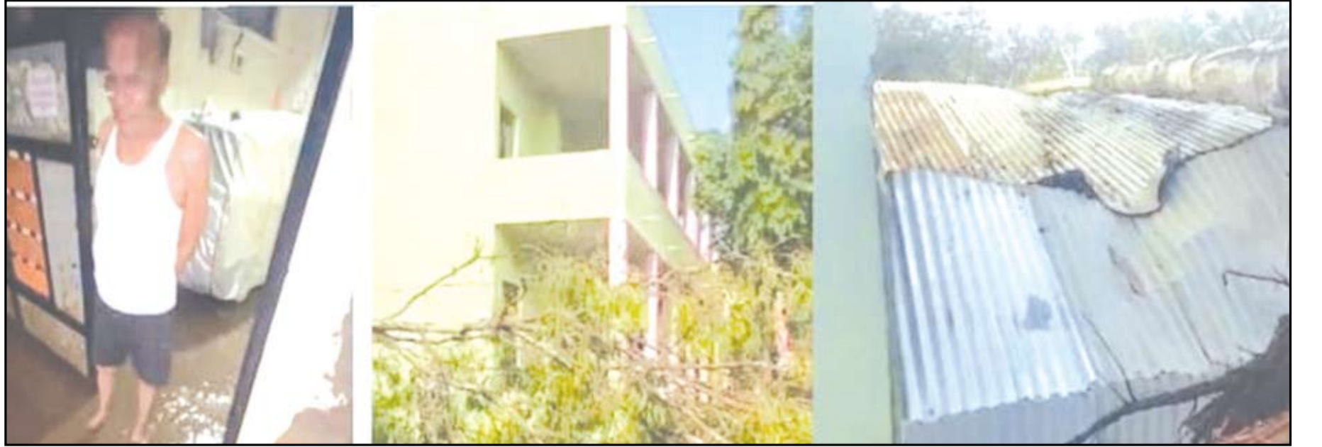
जामखेड तालुक्यात वादळी पावसामुळे वीज पडून घराचे झालेले नुकसान, कोसळलेले झाड तर अनेकांच्या घरात घुसलेले पावसाचे पाणी छायाचित्रात दिसत आहे.