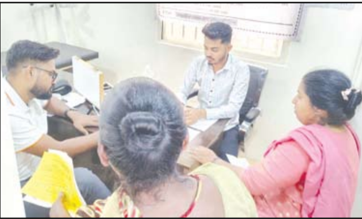
महापालिकेच्या वतीने रामवाडी येथे उभारण्यात आलेले आरोग्य केंद्रात समता फाउंडेशनच्या वतीने आयोजित मोफत नेत्र तपासणी शिबिरास नागरिकांचा प्रतिसाद मिळाला.