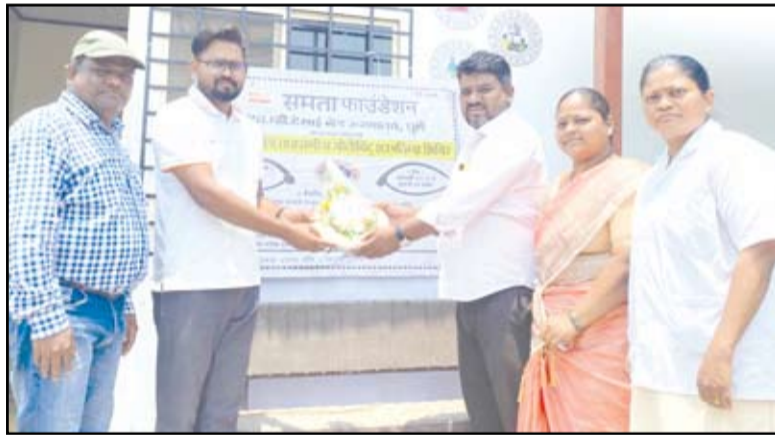
महापालिकेच्या वतीने रामवाडी येथे उभारण्यात आलेले आरोग्य केंद्रात समता फाउंडेशनच्या वतीने आयोजित मोफत नेत्र तपासणी शिबिरास नागरिकांचा प्रतिसाद मिळाला.