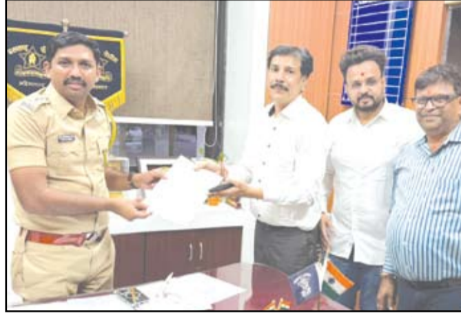
आडते बाजारातील वाहतूकीच्या समस्यांबाबत उपविभागीय पोलीस अधिकारी यांना निवेदन देताना व्यापारी. शेजारील दोन्ही छायाचित्रांमध्ये वाहतूकीची झालेली कोंडी.

या अधिकृत वेब पोर्टलवर जाऊन आपली माहिती नोंदवायची आहे. हे पोर्टल १ ते १५ मे या कालावधीतच खुले राहणार आहे. ऑनलाईन माहिती भरताना प्रश्नावलीत नागरिकांनी स्वतःच्या घरासंबंधी सविस्तर माहिती, पिण्याचे पाणी आणि प्रकाशाचा स्रोत, शौचालयाचा प्रकार आणि उपलब्धता, वाहन (दुचाकी/चारचाकी), संगणक आणि इंटरनेट सुविधा, इतर जीवनावश्यक सोयी-सुविधांची उपलब्धता असतील तर तथा नोंदी कराव्यात. नागरिकांनी स्व-गणना पर्यायाचा लाभ घेऊन पोर्टलवर अचूक माहिती भरावी आणि जबाबदार नागरिकत्वाची ओळख निर्माण करावी. या प्रक्रियेमुळे प्रत्यक्ष क्षेत्रीय कार्याच्या वेळी वेळेची बचत होण्यास मदत होईल. अचूक माहिती भरून देशाच्या नियोजनात आणि धोरण निर्मितीत योगदान देणे हे प्रत्येक नागरिकाचे कर्तव्य आहे.