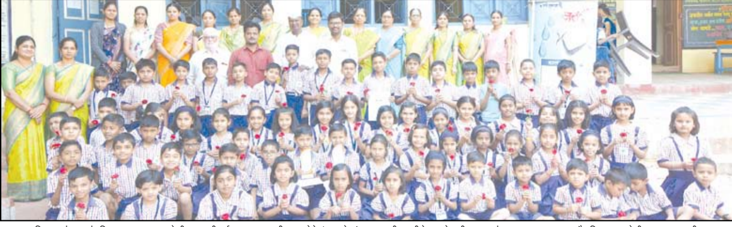
रयत शिक्षण संस्था संचलित कापड बाजार येथील लक्ष्मीबाई भाऊराव पाटील शाळेने 'लक्ष्यवेध' राज्यस्तरीय परीक्षेत उल्लेखनीय यश संपादन करत आपल्या शैक्षणिक गुणवत्तेची छाप उमटवली.