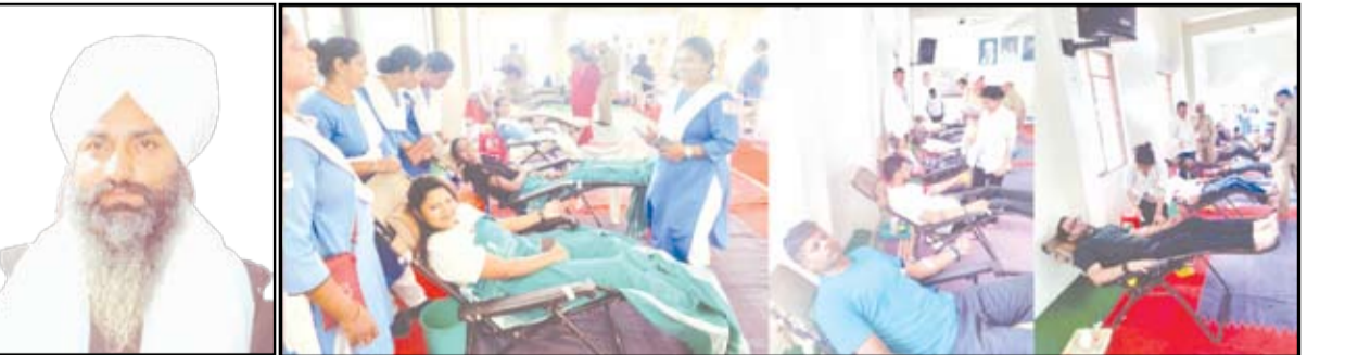
संत निरंकारी मिशनच्यावतीने आयोजित शिबिरात रक्तदान करताना महिला व पुरुष रक्तदाते.

अत्यंत शिस्तबद्ध आणि सेवाभावी वातावरणात पार पडले.