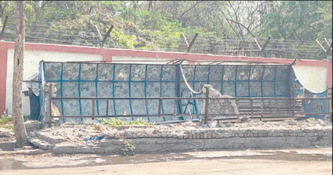
कोठला स्टॅड येथील प्रवासी बस थांबा निवारा कोसळला शहरातील छत्रपती संभाजीनगर ते पुणे राष्ट्रीय महामार्गावरील कोठला स्टॅड येथील प्रवासी बस थांबा निवारा कोसळला आहे. सदर बस थांबा प्रवाशांसाठी उज, बाय, पाऊस या साठी उभारलेला होता परंतु तेथील घाघ व दुर्गंधीमुळे कोणी या प्रवासी निवारा स्टॅड मध्ये थांबत नव्हते. तरी या ठिकाणी अत्याधुनिक प्रवासी निवारा उभा करावा अशी मागणी होत आहे.