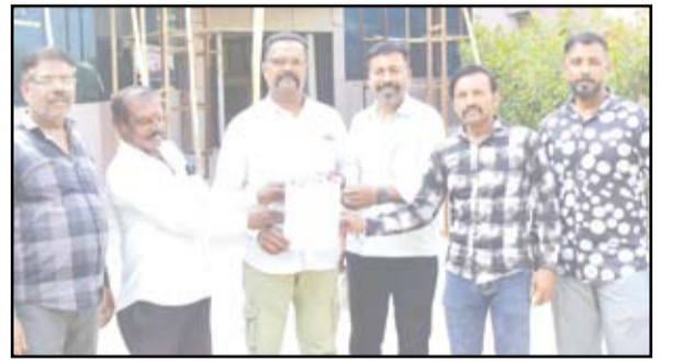
भारतरत्न डॉ. बाबासाहेब आंबेडकर यांच्या १३५ व्या जयंतीनिमित्त शहरात आयोजित करण्यात आलेल्या कार्यक्रमातील गैरव्यवस्थेबाबत भीमशक्तीच्या वतीने मनपा आयुक्ताना निवेदन देण्यात आले.

निवेदनात नमूद करण्यात आले आहे की, १४ एप्रिल रोजी मार्केट याई देथील डॉ. बाबासाहेब आंबेडकर चौकातील स्मारक परिसरात शासकीय स्वरूपाचा जयंती कार्यक्रम आयोजित करण्यात आला होता. मात्र, या कार्यक्रमासाठी करण्यात आलेली व्यवस्था अत्यंत निकृष्ट दर्जाची होती. स्मारक परिसराची रांगोटी व स्वच्छता योग्य पद्धतीने करण्यात आलेली नव्हती. तसेच दरवर्षीप्रमाणे पुतळ्यास पुष्पसजावटही करण्यात आली नसल्याचे निदर्शनास आले. याशिवाय, कार्यक्रमासाठी दरवर्षी हजारो अनुयायी उपस्थित राहत असताना यंदा बैठक व्यवस्थाही अपुरी व विस्कळीत होती. त्यामुळे उपस्थित नागरिकांना मोठ्या प्रमाणात गैरसोयीचा सामना करावा लागला. विशेष म्हणजे, यंदा डॉ. बाबासाहेब आंबेडकर यांच्या