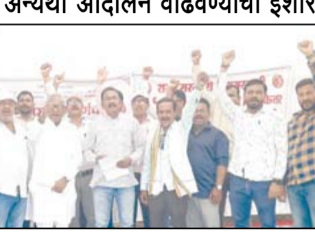
यांना पदस्थानता द्यावी, कायम प्रवास भत्त्यात वाढ करावी, पदोन्नती व अन्य प्रलंबित प्रश्नांवर शासनाने तातडीने निर्णय घ्यावा, अशा विविध मागण्या संघटनेने मांडल्या आहेत. मागण्यांकडे दुर्लक्ष झाल्यास आंदोलन अधिक तीव्र करण्यात येईल, असा इशाराही संघटनाकडून देण्यात आला आहे. शासन व प्रशासनाने याची गांभीर्याने दखल घेऊन कर्मचाऱ्यांना न्याय द्यावा, अशी मागणी करण्यात येत आहे.

नगर - राज्यातील सरकारी, निमसरकारी तसेच शिक्षक-शिक्षकेतर कर्मचाऱ्यांच्या समन्वय समितीच्या नेतृत्वाखाली सुमारे १७ लाख कर्मचाऱ्यांनी विविध मागण्यांसाठी २१ एप्रिल पासून बेमुदत संप पुकारला आहे. या संपाला महाराष्ट्र राज्य हिवताप निर्मूलन कर्मचारी मध्यवर्ती संघटनेच्यावतीने पाठिंबा देण्यात आला आहे.