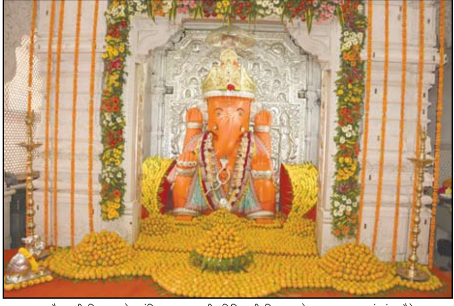
ग्रामदैवत श्री विशाल गणेश मंदिरात अक्षय तृतीयानिमित्त श्री विशाल गणेशाला १११११ आंब्यांचा नैवेद्य दाखवून आंब्यांची सजावट करण्यात आली होती.

बसवेश्वरांबद्दल इतके अभ्यासपूर्ण प्रवचन प्रथमच ऐकायला मिळाले, अशा प्रतिक्रिया उपस्थित श्रोत्यांमधून उत्स्फूर्तपणे उमटल्या. शांतीमंत्र आणि राष्ट्रीय उद् घोषाने कार्यक्रमाची सांगता करताना प्रसाद वाटपही करण्यात आले.