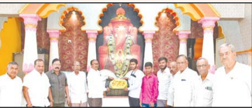
श्री विशाल गणेश मंदिर देवस्थानच्यावतीने अक्षयतृतीये निमित्त भाविकांच्यावतीने देण्यात आलेल्या नैवेद्याचे आंबे आदिवासी शिक्षण संस्था टाकली काझी आणि स्नेहालय संस्था येथील मुलांना हा आंब्यांचा प्रसाद देण्यात आला.

नगर - श्री विशाल गणेशाच्या कृपेने सर्वच उत्सव आता मोठ्या प्रमाणात साजरे होत आहे. दरवर्षीप्रमाणे यंदाही साडेतीन मुहूर्तापैकी एक असलेल्या अक्षय तृतीयेला श्री विशाल गणेश मंदिरात भाविकांनी दिलेल्या आंब्यांच्या प्रसादाचा नैवेद्य दाखविण्यात आला होता. मोठया आकर्षक पद्धतीने श्री विशाल गणेशाची आंब्यांची पुजा बांधण्यात आली होती. या आंब्यांचे दान सत्कारणी लावण्याच्या उद्देशाने आदिवासी शिक्षण संस्था टाकली काझी आणि स्नेहालय संस्था येथील मुलांना हा आंब्यांचा प्रसाद देण्यात आला. समाजातील वंचित घटकांसाठी काम करणाऱ्या संस्थेप्रती कृतज्ञता भाव व्यक्त करण्याचा प्रयत्न केला आहे. आज सामाजिक संस्थांना मदतीचा हात देणे हे प्रत्येकाचे