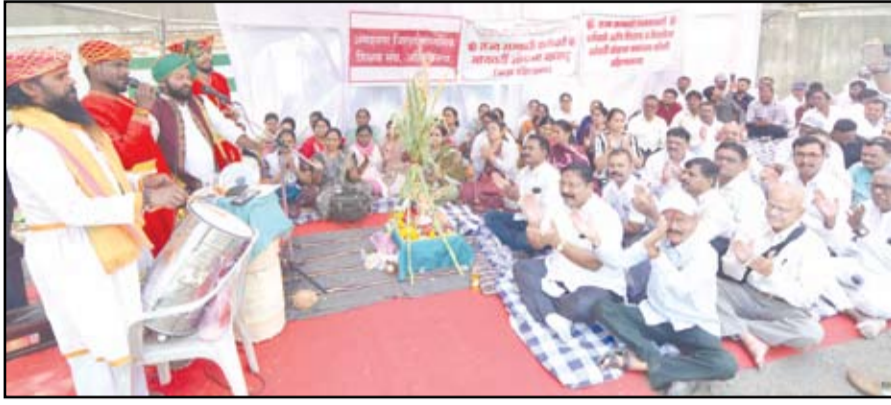
विविध प्रलंबित मागण्यांसाठी शासकीय, निमशासकी कर्मचाऱ्यांनी राज्यव्यापी संप पुकारला आहे. या संपाचा एक भाग म्हणून अहिल्यानगर जिल्हाधिकारी कार्यालयासमोर जागरण गोंधळ घालून शासनविरोधी जोरदार घोषणाबाजी करण्यात आली.