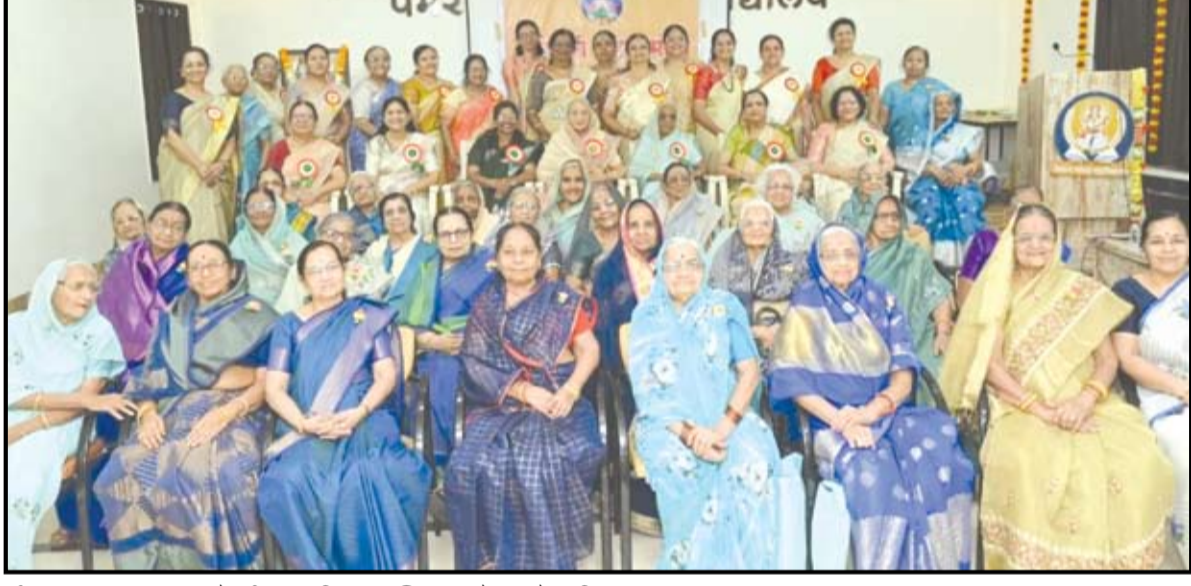
माहेक्षरी समाजातील ७५ व त्यापेक्षा जास्त वय असलेल्या ४० महिलांचा भावपूर्ण सत्कार करण्यात आला. शेजारील छायाचित्रात उपस्थित असलेल्या ज्येष्ठ महिला.