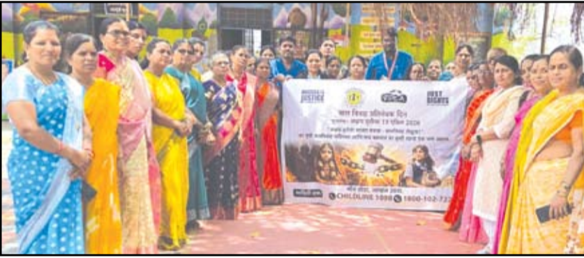
अहिल्यानगर जिल्ह्यात बालहक्कांचे संरक्षण आणि बालविवाह रोखण्यासाठी कार्य करणाऱ्या विपला फाउंडेशन या स्वयंसेवी संस्थेने, बालविवाहांना आळा घालण्यासाठी अक्षय तृतीयेच्या निमित्ताने 'सतर्कता दिवस' पाळला.