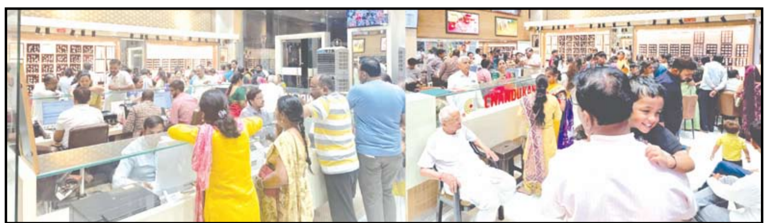
सावेडी येथील चंद्रकाळा ज्वेल्स येथे खास अक्षययत्तृतीयेच्या मुहूर्त साधत सुवर्णखरेदीसाठी ग्राहकांनी मोठी गर्दी केली.

आले. महिंद्राच्या स्कॉर्पिओ, थार आणि एक्सयूव्ही सिरीजला ग्राहकांनी सर्वाधिक पसंती दिल्याचे यावेळी दिसून आले.