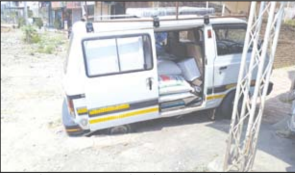
सावेडी उपनगरातील गुलमोहर रोड, पारिजात चौक परिसरात उघड्या चेंबरमध्ये अडकलेले वाहनाचे चाक छायाचित्रात दिसत आहे.

नगर - सावेडी उपनगरातील गुलमोहर रोड, पारिजात चौक परिसरात रस्त्याचे काम करण्यात आले आहे, मात्र या ठिकाणी ड्रेनेजचे चेंबर उघडेच असून त्यावर झाकणे न बसविल्याने नागरिकांची वाहने त्या उघड्या चेंबरमध्ये अडकून अपघात होत असून नागरिकांच्या वाहनांचे मोठ्या प्रमाणात नुकसान होत आहे. वारंवार सूचना देऊनही संबधित ठेकेदारांनी आजपर्यंत अंतर्गत चेंबरवर झाकण बसवलेले नाही. त्यामुळे नागरिकांमध्ये संताप व्यक्त होत आहे.