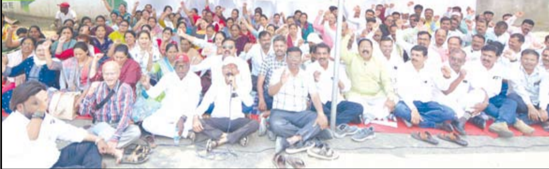
चालढकल केली जात असल्याने कर्मचारी वर्गात तीव्र असंतोष निर्माण झाला आहे. शासनाचे लक्ष वेधूनही मागण्या पूर्ण होत नसल्यामुळे अखेर बेमुदत संपाचा मार्ग स्वीकारावा लागल्याचे संघटनांच्या वतीने स्पष्ट करण्यात आले.

जिल्हाधिकारी कार्यालयासमोर धरणे, जुनी पेन्शन, रिक्त पदे भरण्याच्या मागणीसाठी निर्णायक लढा; आंदोलन तीव्र करण्याचा इशारा