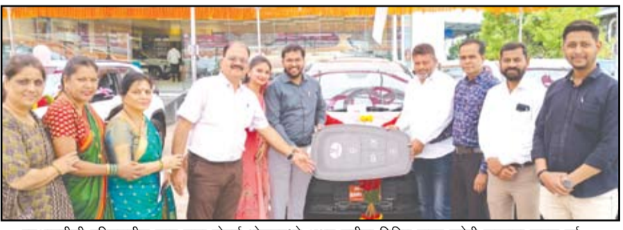
एमआयडीसी परिसरातील कामू टाटा मोटर्समध्ये अक्षय तृतीया निमित्त वाहन खरेदी करताना ग्राहक वर्ग.

ग्राहकांनी शोरूमच्या सेवांबद्दल समाधान व्यक्त करत सांगितले की, सणाच्या दिवशी वाहन खरेदी करणे अधिक सोपे आणि आनंददायी ठरले. उत्कृष्ट सेवा, आकर्षक ऑफर्स आणि मार्गदर्शनामुळे खरेदीचा अनुभव संस्मरणीय ठरला.