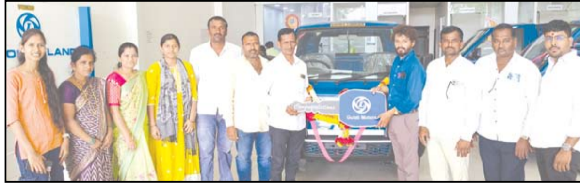
एमआयडीसीत गुलाटी मोटर्समध्ये अक्षय तृतीयेला 'अशोक लेलॅंड'ला मोठी पसंती मिळाली.