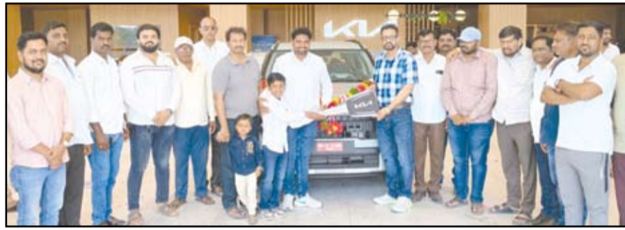
अक्षय तृतीयेच्या मुहूर्तावर पिपाडा किर्या शोरूम येथे ग्राहकांना ५० हून अधिक गाड्यांची विक्री करण्यात आली.