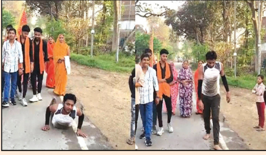
पत्नीपासून वेगळे होण्यासाठी त्या तरुणाने न्यायालयाचा मार्ग निवडला. जवळपास दोन वर्षे