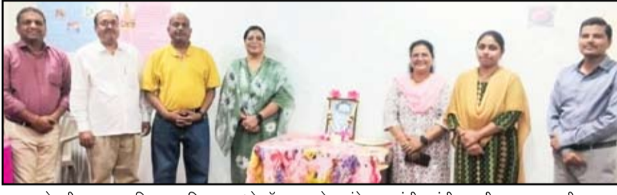
के जी कला व वाणिज्य महाविद्यालयामध्ये डॉ. बाबासाहेब आंबेडकर यांची जयंती साजरी करण्यात आली.