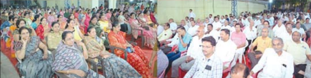
केली. लाईव्ह वाद्यवृंदाच्या साथीने दोघा कलाकारांनी अतिशय भावस्पर्शी गीते सादर

केली. मिलता है सच्चा सुख, रूणु झुणु रे, इतनी शक्ती हमे दे ना दाता, एक लुही भरोसा, ओम नमः शिवाय, उड जायेगा हंस अकेला, अरे अरे ज्ञाना झाला, विश्वाचे आर्त माझ्या मनी, सुबह सवेरे लेके तेरा नाम प्रभू, त्याग की सुनो अद्भुत कहानी अशा गीतांनी कार्यक्रमाला उपस्थित सर्वांना एक वेगळीच अनुभूती मिळाली. उपस्थित भाविक भक्तीरसात न्हाऊन निघाले. मनात रंजी घालणारे गीते हृदयात साठवून सर्वांनी दोघा गायकांचे कौतुक केले.