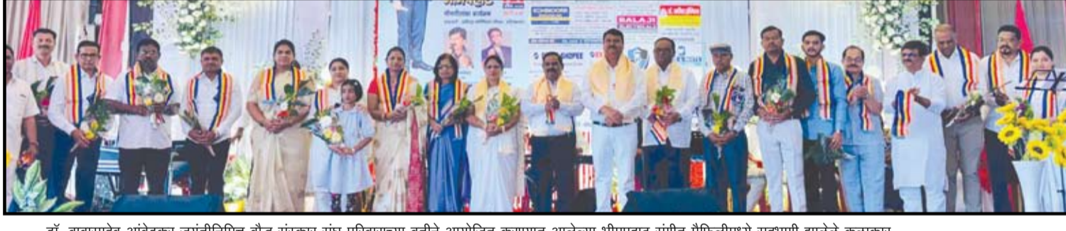
डॉ. बाबासाहेब आंबेडकर जयंतीनिमित्त बौद्ध संस्कार संघ परिवाराच्या वतीने आयोजित करण्यात आलेल्या भीमपहाट संगीत मैफिलीमध्ये सहभागी झालेले कलाकार.