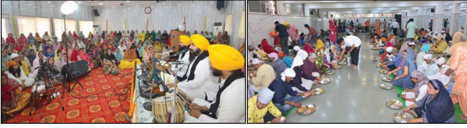
गुरुद्वारा भाई दयासिंहजी, गोविंदपुरा येथे १४ रोजी एप्रिल बैसाखी गुरुपूरब भक्तीपूर्ण वातावरणात उत्साहात साजरा झाला.