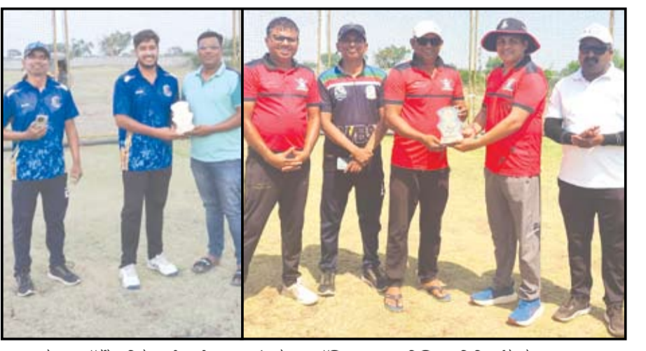
फ्रेडस् कॉर्पोरेट क्रिकेट लीगमधील सामन्यांमध्ये नगर चॅम्पियन व नगर डिस्ट्रिक्ट सिनिअर्सचे खेळाडू.