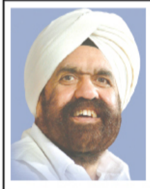
सही समझ का सार

यह है कि जीवन में जो कुछ भी घटे, उससे संतुष्ट रहो, क्योंकि वह सदा दिव्य दया से सुगंधित होता है और हमारे आध्यात्मिक उत्थान के लिए होता है। आध्यात्मिक शिष्य ऐसे उच्च विवेक का आनंद उठाते हैं। परिस्थिति का बहादुरी से सामना करने का आपका रुख आपको अवश्य ही आंतरिक शांति और सौहार्द से धन्य कर देगा।