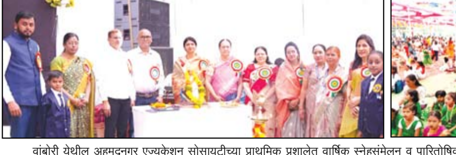
वांबोरी येथील अहमदनगर एज्युकेशन सोसायटीच्या प्राथमिक प्रशालेत वार्षिक स्नेहसंमेलन व पारितोषिक वितरण समारंभ उत्साहात झाले.

नववी व दहावीच्या विद्यार्थ्यांसाठी सुरु असलेल्या मार्गदर्शन वर्गांमुळे विद्यार्थ्यांचा आत्मविश्वास वाढून शैक्षणिक निकालात सकारात्मक बदल होत असल्याचे स्पष्ट करण्यात आले. प्रमाणपत्र वितरण प्रसंगी महिलांना गुणवत्तापूर्ण कौशल्य विकासाचे महत्त्व सांगण्यात आले. केवळ प्रशिक्षण घेणे नव्हे, तर त्या कौशल्याच्या आधारे सातत्यपूर्ण व दर्जेदार सेवा देऊन आर्थिक स्वावलंबन साधता येते, असा संदेश देण्यात आला. बचत गटांचे फायदे, स्वयंरोजगारासाठी आवश्यक प्रक्रिया, उद्यम कार्ड, शॉप अॅन्ड नोंदणी तसेच विविध शासकीय योजनांची माहिती महिलांना देण्यात