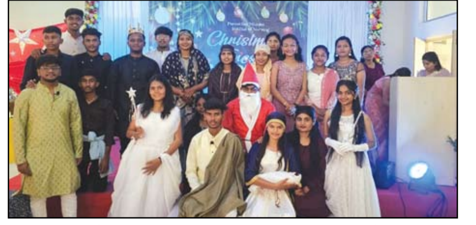
पार्वतीबाई म्हस्के नर्सिंग इन्स्टिट्यूटच्या विद्यार्थ्यांनी नाताळ सण उत्साहात साजरा केला.