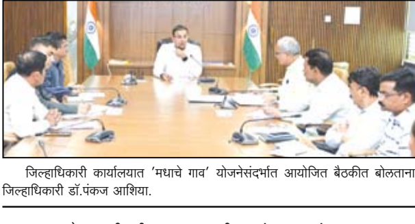
जिल्हाधिकारी कार्यालयात 'मधाचे गाव' योजनेसंदर्भात आयोजित बैठकीत बोलताना जिल्हाधिकारी डॉ.पंकज आशिया.

जिल्हाधिकारी डॉ. पंकज आशिया यांचे निर्देश नगर - मधमाशा संवर्धनातून निसर्गाचे रक्षण करणे, तसेच मध आणि मधमाशांपासून मिळणाऱ्या उत्पादनांवर प्रक्रिया व विक्री व्यवस्था निर्माण करून 'मधुपर्यटन' वाढवणे, या उद्देशाने अकोले तालुक्यातील 'मौजे उडदावणे' गावाची निवड करण्यात आली आहे. या गावात 'मधाचे गाव' योजनेची प्रभावी अंमलबजावणी करण्याचे निर्देश जिल्हाधिकारी डॉ. पंकज आशिया यांनी दिले.