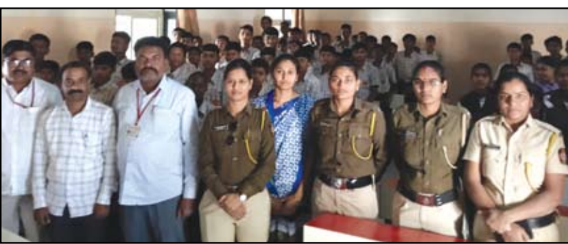
राष्ट्रीय पाठशाळा विद्यालयात निर्भया पथकाकडून विद्यार्थी सुरक्षिततेबाबत जनजागृती करण्यात आली.