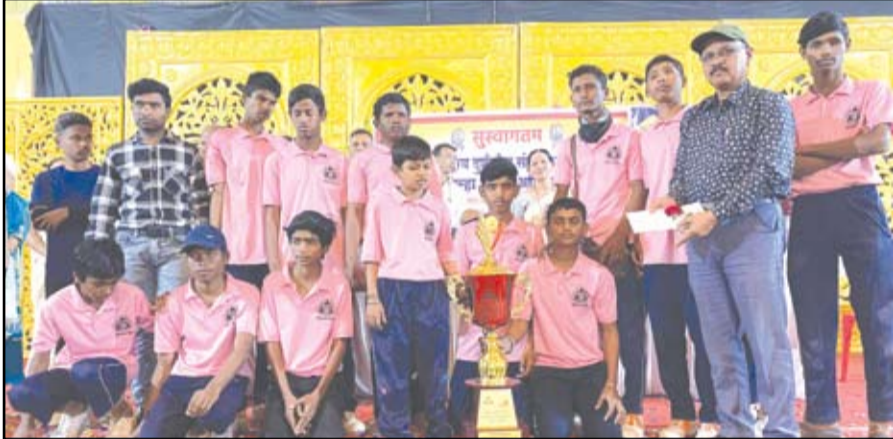
राष्ट्रीय दृष्टिहीन संघ, महाराष्ट्र व जिल्हा शाखा अहिल्यानगर यांच्या संयुक्त विद्यमाने आयोजित शालेय अंध मुलांची जिल्हास्तरीय क्रिकेट स्पर्धा २०२५ अहिल्यानगर जिल्ह्यात उत्साहात पार पडली.