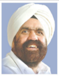
गुरु और परमात्मा

और जब उसकी अधिक दया होती है, तो हमें नाम की देन मिलती है. वह नाम की देन, जो हमारी आत्मा को प्रभु की ज्योति और उसकी श्रुति के साथ जोड़ देती है। बाहरी रूप में प्रभु को किसी ने न देखा है और न ही देखेगा। उसका कोई इंसानी चोला नहीं है, लेकिन जो उसके रूप हैं, उसकी 'ज्योति' और उसकी 'श्रुति', जिसे 'शब्द' कहा गया है, जिसे 'नाम' कहा गया है, जिसे Holy Word कहा गया है, जिसे Logos कहा गया है, उसका अनुभव हम अपने अंतर में कर सकते हैं। नामदान के समय पर