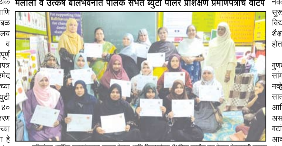
महिलांच्या आर्थिक स्वावलंबनाला चालना देणारा आणि विद्यार्थ्यांच्या शैक्षणिक प्रगतीस बळ देणारा प्रेरणादायी उपक्रम स्नेहालय संचालित मलाला बालभवन व उत्कर्ष बालभवन येथे एकल महिलांना प्रमाणपत्र वाटपाचा कार्यक्रम पार पडला.

नगर - महिलांच्या आर्थिक स्वावलंबनाला चालना देणारा आणि विद्यार्थ्यांच्या शैक्षणिक प्रगतीस बळ देणारा प्रेरणादायी उपक्रम स्नेहालय संचालित मलाला बालभवन व उत्कर्ष बालभवन येथे उत्साहपूर्ण वातावरणात एकल महिलांना प्रमाणपत्र वाटपाचा कार्यक्रम पार पडला. उमेद प्रकल्पांतर्गत जनशिक्षण संस्थेच्या शासकीय मान्यताप्राप्त केंद्रातून ब्युटी पार्लर प्रशिक्षण पूर्ण केलेल्या ४० गर्जू महिलांना प्रमाणपत्र वितरण करण्यात आले.तसेच विद्यार्थ्यांच्या प्रगतीसाठी आयोजित पालक सभा हे या कार्यक्रमाचे मुख्य आकर्षण ठरले.