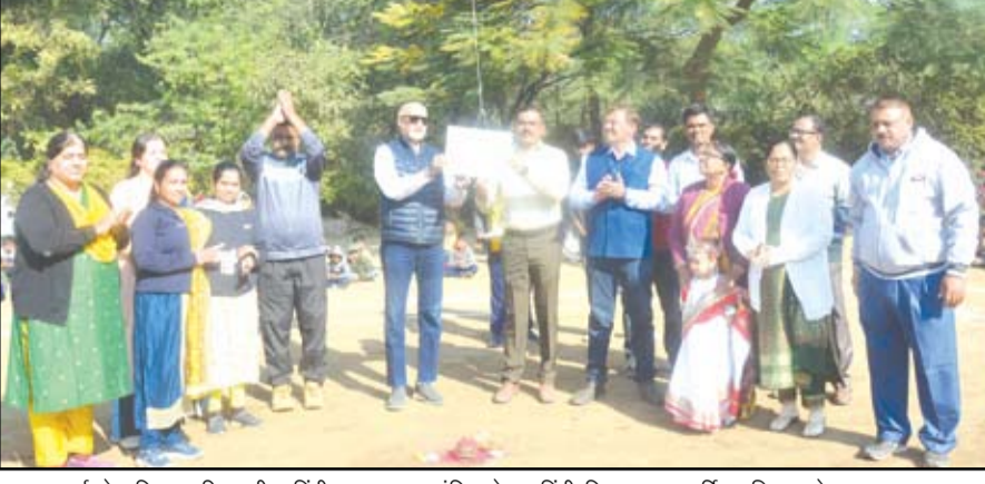
भुईकोट किल्ला परिसरातील हिंदी माध्यमाच्या पंडित नेहरू हिंदी विद्यालयात वार्षिक क्रीडा महोत्सव पार पडला.

भुईकोट किल्ला परिसरातील हिंदी माध्यमाच्या पंडित नेहरू हिंदी विद्यालयात वार्षिक क्रीडा महोत्सव उत्साहात पार पडला. शाळेच्या प्रशस्त प्रांगणात आयोजित करण्यात आलेल्या या महोत्सवात विविध मैदानी क्रीडा स्पर्धांमध्ये विद्यार्थ्यांनी उत्स्फूर्त सहभाग घेत आपल्या क्रीडा कौशल्याची चुणूक दाखवली. दोन दिवस चालणाऱ्या या महोत्सवामुळे संपूर्ण शालेय वातावरण क्रीडामय बनले आहे.