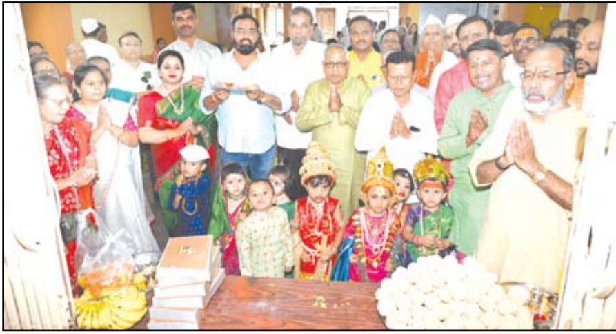
आषाढी एकादशी निमित्त अहिल्यानगर जिल्हा ब्राह्मण सेवा संघ व शिशुविहार बालवाडीच्या संयुक्त विद्यमाने बाल वारकऱ्यांची दिंडी काढून श्री विठ्ठल रुक्मिणी देवतांची महाआरती करण्यात आली