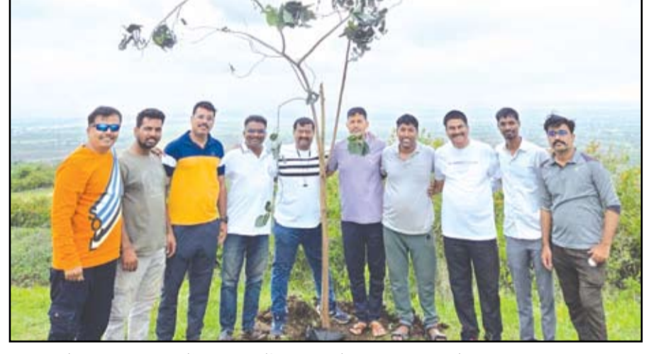
निवेश इंडिया कंपनीतर्फे गर्भगिरी डोंगरात वृक्षारोपण करण्यात आले.