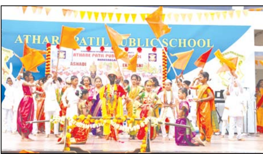
आठरे पाटील पब्लिक स्कूलमध्ये आषाढी एकादशी निमित्त चिमुकल्या वारकऱ्यांचा दिंडी सोहळा उत्साहात झाला.

नगर - अहमदनगर शहराच्या सावेडी विभागातील आठरे पाटील पब्लिक स्कूल या इंग्रजी माध्यमाच्या वसतिगृहात्मक शाळेच्या विद्यार्थ्यांना पारंपारिक धार्मिक सण, उत्सव अवगत व्हावे व त्यांच्या सर्वांगीण व्यक्तिमत्त्व विकासासाठी अनेक उपक्रमांचे आयोजन केले जाते. ५ जुलै रोजी पूर्व प्राथमिक, प्राथमिक व माध्यमिक विभागाच्या चिमुकल्या बालगोपाळांनी वारकऱ्यांची वेशभूषा करून, पालखी मिरवणुकीद्वारे विठ्ठल नामाच्या जयघोषात व उत्साही वातावरणात दिंडी सोहळा साजरा केला. आषाढ धारांचे आगमन आणि पंढरीच्या वारीची आस वारकरी, विणेकरी, टाळ, मृदुंगाचा गजर करीत पायी वारी संपूर्ण राज्यातील विठ्ठल भक्तीने न्हाऊन निघाली आहे. अशातच आषाढी एकादशीच्या निमित्ताने आठरे पाटील पब्लिक स्कूलच्या बाल वारकऱ्यांनी विठ्ठल नामाची शाळा भरवली होती. वारीचा आनंद घेण्यासाठी शाळेतील विद्यार्थ्यांनी दिंडी काढून हा सोहळा उत्साहात साजरा केला. शाळेतील सर्व विद्यार्थी हातात भगव्या पताका व टाळ घेऊन विठ्ठल नामाचा जयघोष करत