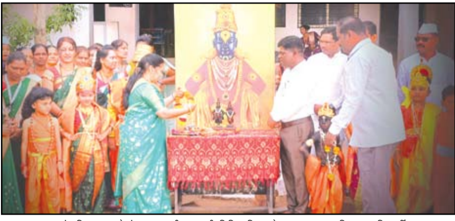
जय बजरंग विद्यालयमध्ये रंगला आषाढी एकादशी निमित्त विठ्ठलाचे पूजन करताना शिक्षक व विद्यार्थी.

यांच्यासह तृतीय वर्षाच्या विद्यार्थ्यांनी सहभाग घेतला होता. या शिबिरात वारकऱ्यांच्या पायावर तीळ तेलाचे स्नेहन करणे तसेच विविध आजारांवर औषधोपचार करण्याची सेवा सहभागींनी दिली.