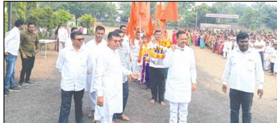
रामराव चव्हाण माध्यमिक विद्यालयाच्या शालेय वारकऱ्यांचा पायी दिंडी सोहळ्यामध्ये सहभागी झालेले शिक्षक.