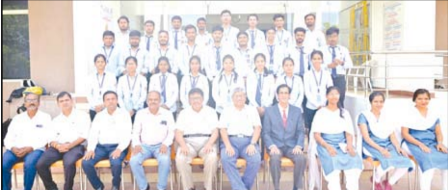
डॉ. विखे पाटील अभियांत्रिकी महाविद्यालयात इलेक्ट्रिकल इंजिनिअरिंग विभागाच्या २० विद्यार्थ्यांचे प्लेसमेंटद्वारे मल्टिनॅशनल कंपनीमध्ये नोकरीसाठी निवड झालेले विद्यार्थी, कॉलेजचे प्राचार्य, प्राध्यापक, शिक्षक वृंद.