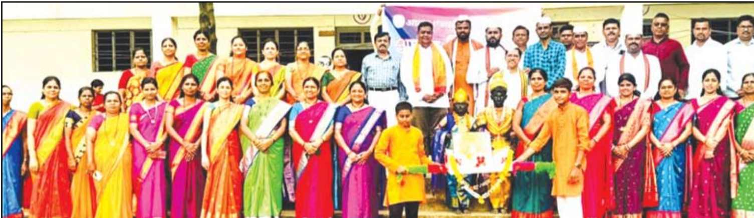
गुलमोहर रोड आनंद विद्यालय शाळेत आषाढ दिंडी वारी कार्यक्रम उत्साहात पार पडला.

डोक्यावर तुळस आणि विठ्ठल नामाची शाळा भरली या अभंगाप्रमाणे विठ्ठल रघुमाईंच्या भक्तीत दंग झालेले अनेक बाल वारकरी आज शाळेत अवतरले. यावेळी ज्ञानाच्या मंदिरात भोव्या विठ्ठलाच्या हरिनामाचा गजर झाला. अन अवधी शाळा दिंडी सोहळ्याच्या भक्तीरसात तल्लीन झाल्याचे पाहायला मिळाले. सर्व शिक्षकांनी जय जय राम कृष्ण हरी, रूप पाहता लोचनी सुख झाले हो साजणी, ज्ञानोबा माऊली तुकाराम या अभंगांचे गायन करून टाळ व वीणा यांच्या तालावर ठेका धरत नृत्य तसेच विठ्ठल फुगडी खेळून प्रत्यक्षतः श्रीक्षेत्र पंढरपुरातील भक्तिमय वातावरण रेवढे स्टेशन परिसरात निर्माण झाले. सर्व विद्यार्थी आणि शिक्षकांनी पारंपारिक वारकरी वेशभूषा, तुळशी व भगवे ध्वज घेऊन अभंगांच्या ठेक्यावर नृत्य व फुगडी चा आनंद घेतला आणि या नयनरम्य सोहळ्यात आपली भक्ती अभिव्यक्त केली. नाशिक येथील एक अज्ञात उद्योजक यांनी सर्व विद्यार्थ्यांना खाऊ वाटप केले. रिंगण आटोपल्यावर परिसरातून फेरी काढत विठ्ठल मंदिरात टाळ मृदुंगाच्या गजरात विठ्ठलाची भजने गात आणि पसायदान म्हणत या सोहळ्याचा शेवट झाला. दरवर्षी शाळेत दिंडीचे आयोजन केले जाते. या दिंडी द्वारे आम्ही परिसरात विविध सामाजिक संदेश देण्याचाही प्रयत्न करत असतो. यंदचा हा रिंगण सोहळा