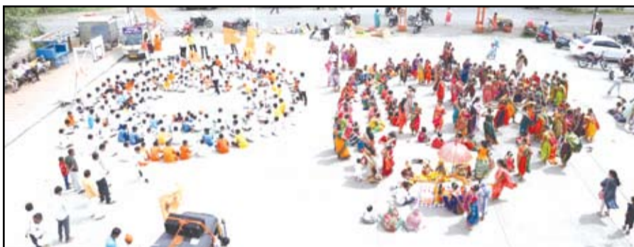
केडगाव येथील ज्ञानसाधना गुरुकुल क्लासेसच्या वतीने आषाढी एकादशीनिमित्त पायी दिंडी काढण्यात आली.