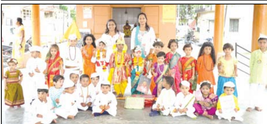
ग्रीन स्पार्क स्कूलच्या चिमुकल्यांनी दिंडीतून संत परंपरेचा जागर केला.