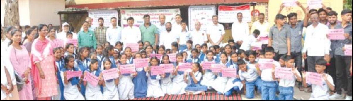
बुरुडगाव रोड भोसले आखाडा परिसरात डॅंग्यूमुक्त जनजागृती मोहीम राबविण्यात आली.