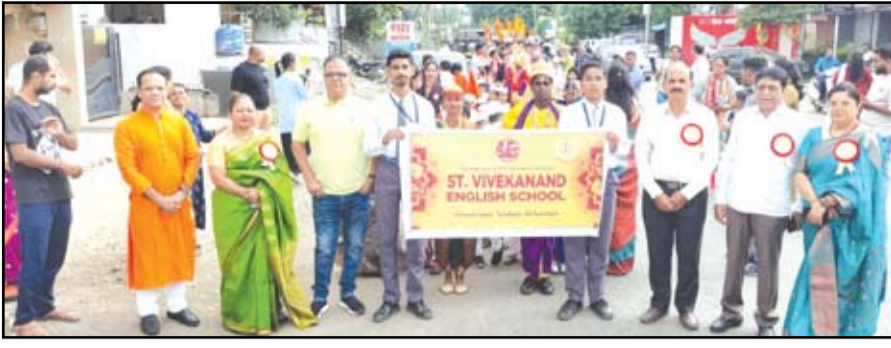
आषाढी एकादशीनिमित्त सेंट विवेकानंद इंग्लिश स्कूलने बाल दिंडीचे आयोजन करण्यात आले होते.

नगर - आषाढी एकादशी म्हणजे वारकरी सांप्रदायाचा सर्वात मोठा उत्सव. आषाढी एकादशीनिमित्त लाखोंच्या संख्येचे वारकरी, भक्त पंढरपूरमध्ये विठ्ठलाच्या दर्शनासाठी दाखल होतात. या पार्श्वभूमीवर सेंट विवेकानंद इंग्लिश स्कूलने बाल दिंडीचे आयोजन करून महाराष्ट्राच्या अध्यात्मिक वैभवाचे संस्कार दर्शविले. या दिंडीमध्ये पूर्व प्राथमिक ते इयत्ता दहावी पर्यंतचे सर्व बाल वारकरी हरिभक्ति तल्लीन झाले.