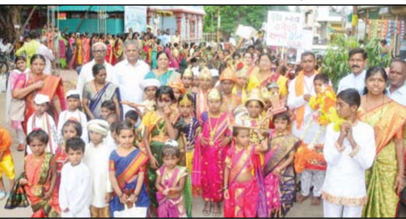
श्री मार्कंडेय विद्यालयाच्या विद्यार्थ्यांनी आषाढी एकादशी निमित्त उत्साहात सावेडी उपनगरातून दिंडी काढून पर्यावरण संवर्धनाचा व मुलगी वाचवा... मुलगी शिकवाचा संदेश दिला.

नगर - श्रमिकनगर येथील श्री मार्कंडेय विद्यालयाच्या विद्यार्थ्यांनी आषाढी एकादशी निमित्त उत्साहात सावेडी उपनगरातून दिंडी काढून पर्यावरण संवर्धनाचा व मुलगी वाचवा... मुलगी शिकवाचा संदेश दिला. विठ्ठल विठ्ठल...विठ्ठला हरी ओम विठ्ठला..., ज्ञानबा तुकाराम..., विठ्ठल माझा माझा... मी विठ्ठलाचा..., माऊली...माऊली... या भक्तीगीतांमध्ये तल्लीन होऊन विठ्ठल नामाच्या जय घोषात, टाळ-मृदंगाच्या गजरात, लेझिम व ढोल पथकासह दिंडी सोहळा रंगला होता.