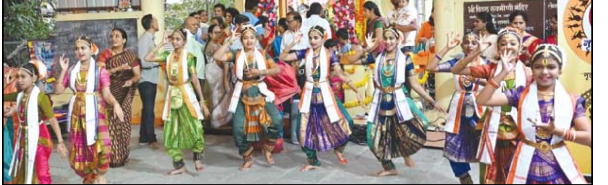
अभंगनृत्य कार्यक्रमात नृत्यसाधक संस्थेच्या विद्यार्थिनींनी विविध संतांच्या अभंगांवर नृत्याविष्कार करत नृत्यसेवा विठ्ठलाच्या चरणी अर्पण केली.

नगर - नृत्यसाधक संस्थेच्या विद्यार्थिनींनी 'अभंगनृत्य' ही अनोखी नृत्यसेवा विठ्ठलाच्या चरणी अर्पण केली. आषाढी एकादशी निमित्त झालेल्या या अभिनव उपक्रमात नृत्यांगणांनी भरतनाट्यमच्या भावाभिनयातून विविध संतांचे जीवन व विठ्ठल भक्तीचे केलेल्या सादरीकरणाने उपस्थित भाविक मंत्रमुग्ध झाले. गुलमोहर रोड वरील विठ्ठल रुक्मिणी मंदिरात झालेल्या जाऊ संतांची या गावा या कार्यक्रमात विविध संतांच्या अभंगमधील भक्तीभाव नृत्यांगणांनी आपल्या नृत्याविष्कारातून सादर करत उपस्थितांची मने जिंकली. यामध्ये अहिल्यानगर मधील नृत्यसाज अकॅडमी, राधिका डान्स अकॅडमी व नृत्यदर्पण डान्स अकॅडमीच्या विद्यार्थिनी सहभागी झाल्या होत्या. आषाढी एकादशी निमित्त मंदिरात आलेला प्रत्येक भाविक हा अनोखा नृत्याविष्कार पाहण्यासाठी थांबत होता. यावेळी उत्कृष्ट सादरीकरणाने अनेक नृत्यांना वन्समोअर मिळाले. या कार्यक्रमात चल ग सखे पंढरीला, तुम्ही संत मायबाप, ओम नमोजी आद्य, खेळ मांडियेला वाळवंटी, वेढा वेढा पंढरी, तुझे रूप चित्री राहो, कानडा राजा पंढरीचा, अबीर गुलाल उधळीत, नामदेव किर्तन करी, संत जनाबाई, येई हो विठ्ठले, अवघा