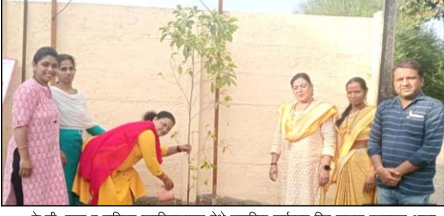
के.जी. कला व वाणिज्य महाविद्यालयात येथे जागतिक पर्यावरण दिन साजरा करण्यात आला.