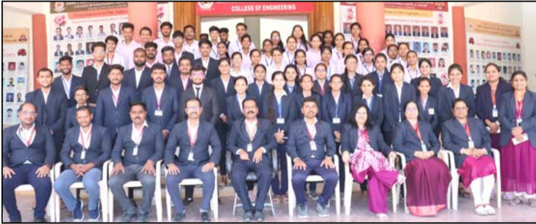
छत्रपती अभियांत्रिकीमध्ये आयोजित प्लेसमेंटच्या विविध संघींचा लाभ घेत विद्यार्थ्यांनी कंपनीमध्ये निवड निश्चित केली आहे.

नगर - छत्रपती अभियांत्रिकीमध्ये आयोजित प्लेसमेंटच्या विविध संघींचा लाभ घेत विद्यार्थ्यांनी नामांकित कंपनीमध्ये निवड निश्चित केली आहे. मेकॅनिकल इंजिनिअरिंग विभागासाठी १००% प्लेसमेंट झाली असून सिव्हिल इंजिनिअरिंग ७४% तर कम्प्युटर इंजिनिअरिंगसाठी ६२% आणि इलेक्ट्रॉनिक्स अॅण्ड टेलिकम्युनिकेशनच्या ६८% विद्यार्थ्यांची प्लेसमेंट विविध कंपनीमध्ये झाली आहे. यामध्ये नगर, सुपे, चाकण, रांजणगाव, नाशिक येथील खाजगी कंपनी, काही शासकीय, निमशासकीय तसेच बहुराष्ट्रीय कंपनीमध्ये विद्यार्थ्यांनी नोकरी मिळवत महाविद्यालयाचे नाव एका वेगळ्या