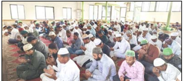
केडगाव येथे शाही जांमिया मशिदीमध्ये बकरी ईदची नमाज अदा केली.