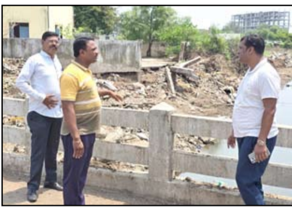
पावसामुळे नुकसान झालेल्या केडगाव अमरधाम, आंबेडकर भवनाची आयुक्तांकडून पाहणी करण्यात आली.