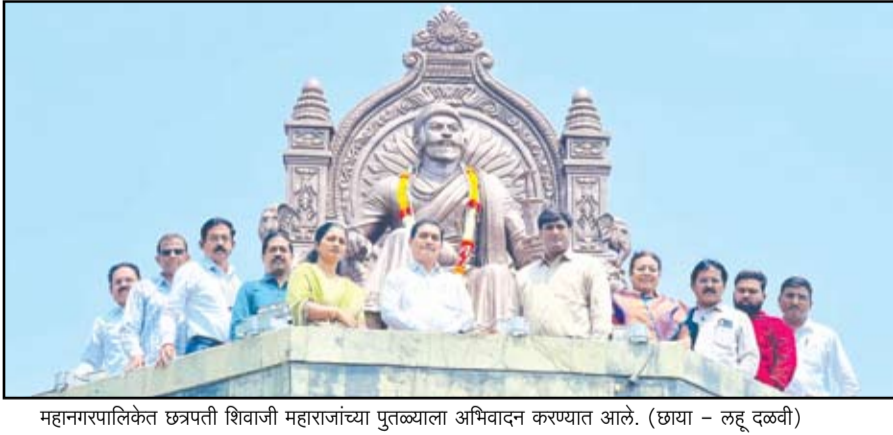
महानगरपालिकेत छत्रपती शिवाजी महाराजांच्या पुतळ्याला अभिवादन करण्यात आले.