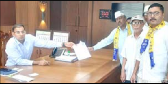
शासकीय वैद्यकीय महाविद्यालय शहरालगत करा अशा आशयाचे निवेदन आम आदमी पार्टीच्यावतीने जिल्हाधिकाऱ्यांना देण्यात आले.

२५ ते ३० एकर जागाही उपलब्ध आहे. मुख्यमंत्री व संबंधित समितीला आपच्या माध्यमातून पत्रव्यवहार करण्यात आलेला असून, जनतेच्या सोयीचा व हिताचा विचार करून भूमिका घेण्याचे स्पष्ट करण्यात आले आहे. शिर्डीला आधीच एक मोठे हॉस्पिटल असून, हे महाविद्यालय तिकडे नेण्यास संपूर्ण जिल्ह्याचा लाभ मर्यादित राहील. नगर शहरालगत हे महाविद्यालय झाल्यास जिल्हा रुग्णालयाचा