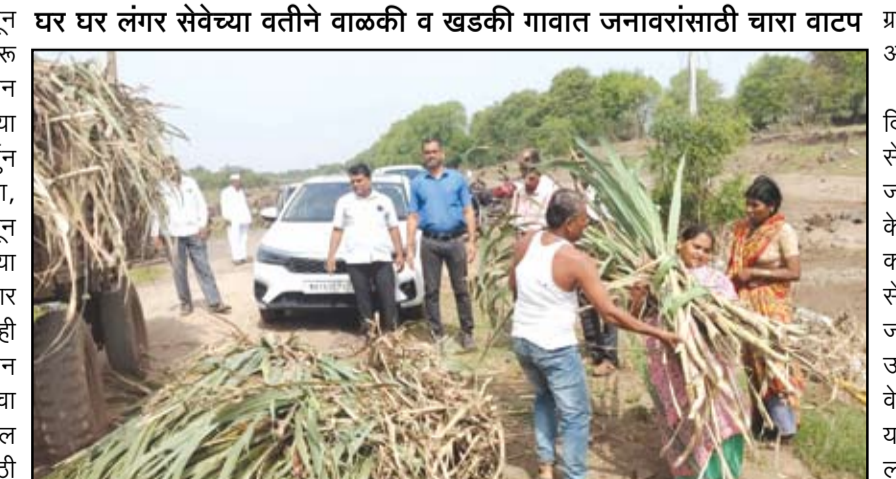
मुक्या जनावरांना चारा उपलब्ध करून गुरु अर्जुन देवजी यांना अभिवादन करण्यात आले.

नगर - कोरोना काळापासून गरजूंची भूकभागविणाऱ्या गुरु अर्जुन देवजी सामाजिक प्रतिष्ठान संचलित घर घर लंगर सेवेच्या वतीने शीख धर्माचे पाचवे गुरु अर्जुन देवजी यांच्या शहिदी दिवस सेवा, बलिदान आणि करुणा दिवस म्हणून साजरा करण्यात आला. माणसांच्या संकटकाळात धावून जाणारी लंगर सेवा प्रामुखांची भूक भागविण्यासाठीही धावली. मुसळधार पावसाने थेमान घातलेल्या व जनावरांच्या चाच्याचा प्रश्न उद्भवलेल्या नगर तालुक्यातील वाळकी व खडकी गावात जनावरांसाठी चारा वाटप करण्यात आले. मुक्या जनावरांना चारा उपलब्ध करून गुरु अर्जुन देवजी यांना आगळ्या-वेगळ्या पध्दतीने अभिवादन करण्यात आले.