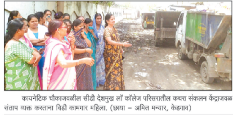
कायनेटिक चौकाजवळील सीडी देशमुख लॉ कॉलेज परिसरातील कचरा संकलन केंद्राजवळ संताप व्यक्त करताना विडी कामगार महिला.

विडी कामगार महिलांचा इशारा नगर - गेल्या अनेक दिवसांपासून मनपाने सीनानदी लागते शहरातील कचरा संकलन केंद्र स्थलांतरित करून कायनेटिक चौक येथील सीडी देशमुख लॉ कॉलेज व साबळे वाघिरे विडी कंपनीच्या मागील असणाऱ्या मोकळ्या जागेत हलविले. हे करत असताना महापालिकेने स्थानिक वसाहतीचा तसेच या ठिकाणी असणारे लॉ कॉलेज मधील विद्यार्थ्यांचा, विडी कंपनीतील महिला कामगार वर्गाच्या आरोग्याचा कुठलाही विचार