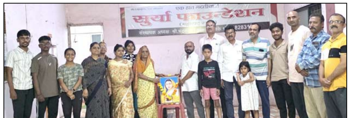
सूर्या फाउंडेशनच्यावतीने अहिल्याबाई होळकर यांच्या ३०० व्या जयंती निमित्ताने कार्यक्रमाचे आयोजन करण्यात आले.