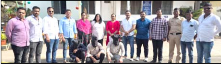
गोवंशीय जनावरांची कत्तल करून गोमांस विक्री करणाऱ्या टोळीचा हद्दपारीचा प्रस्ताव मंजूर झाल्यानंतर या टोळीला ताब्यात घेतलेले कोतवाली पोलिसांचे पथक.