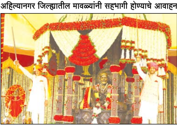
अहिल्यानगर जिल्ह्यातील मावळ्यांनी सहभागी होण्याचे आवाहन

५ जून दु.३.३० वा.राजमाता जिजाऊ साहेब यांच्या समाधीस अभिवादन करून शिवराज्याभिषेक सोहळ्यास