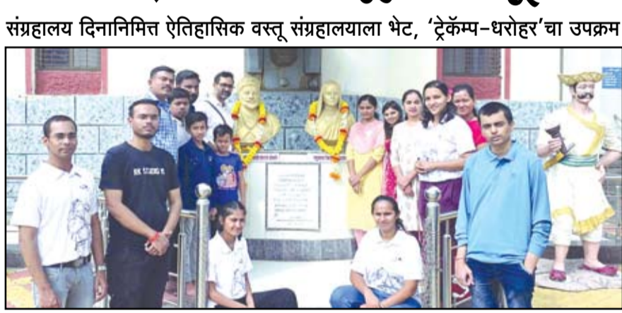
संग्रहालय दिनानिमित्त नगरच्या ऐतिहासिक वस्तू संग्रहालय व संशोधन केंद्राला भेट देण्यात आली.

नगर - जागतिक संग्रहालय दिनानिमित्त ट्रेकॅम्प धरोहर अंतर्गत नगरच्या ऐतिहासिक वस्तू संग्रहालयाला दिलेल्या भेटीत नागरिकांना जुनी शस्त्रे, नाणी, तसेच अनेक मूर्ती पाहावयास मिळाल्या. आपल्या संस्कृतीचे संवर्धन व्हावे, त्याची माहिती आजच्या पिढीला व्हावी यासाठी ट्रेकॅम्प-धरोहर विविध स्थळांना भेटी देत असते. त्याअंतर्गतच जागतिक संग्रहालय दिनानिमित्त नगरच्या ऐतिहासिक वस्तू संग्रहालय व संशोधन केंद्राला भेट देण्यात आली. संग्रहालयामध्ये असणारी विविध दालने, मुर्त्या या सर्वांची ओळख करून घेत आपला सांस्कृतिक वारसा जपण्याची समजूत घेण्याबाबत उपस्थितांना माहिती देण्यात आली. संग्रहालयामधील वेगवेगळ्या प्राचीन वस्तूंचा संग्रह आपल्या नगरच्या लोकांना कळावा तसेच तरुण वर्ग आणि लहान मुलांना या सगळ्या जुन्या संस्कृतीशी ओळख व्हावी हे उद्दिष्ट ठेवून ऐतिहासिक