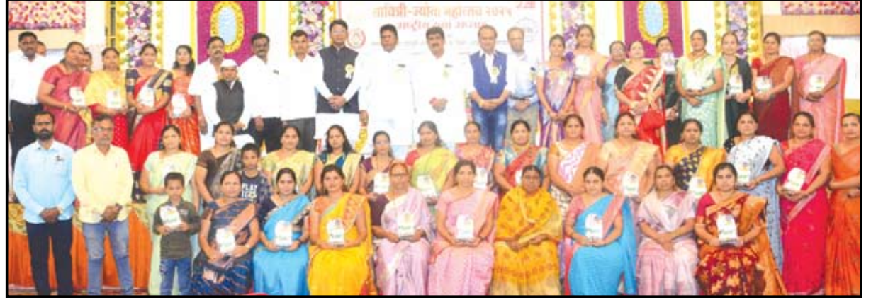
कोहिनूर मंगल कार्यालयात आयोजित सावित्री ज्योती महोत्सवाचे वीर माता-पत्नींच्या हस्ते उद्घाटन करण्यात येवून त्यांचा सन्मान करण्यात आला.