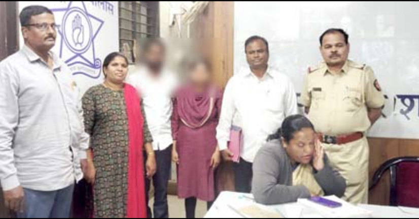
कसारा दुमाला (ता. संगमनेर) येथून ६ वर्षापूर्वी पळवून नेलेल्या अल्पवयीन मुलीला व आरोपीला शोधून चाकण येथून ताब्यात घेतल्या नंतर त्यांच्या समवेत अनैतिक मानवी वाहतुक प्रतिबंध कक्षातील पथक.