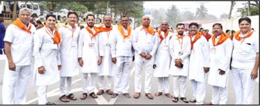
नगरमधील तिरुपती बालाजी भक्तांनी श्री वारी सेवा करून ७ दिवस भक्तांच्या सेवेचा आनंद घेतला.