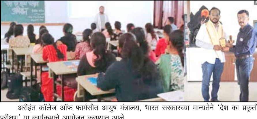
अरीहंत कॉलेज ऑफ फार्मसीत आयुष मंत्रालय, भारत सरकारच्या मान्यतेने ‘देश का प्रकृती परीक्षण’ या कार्यक्रमाचे आयोजन करण्यात आले.