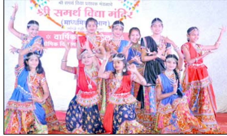
श्री समर्थ विद्या प्रशाला माध्यमिक विभागाचे वार्षिक स्नेहसंमेलनात नृत्यकला सादर करताना विद्यार्थी.