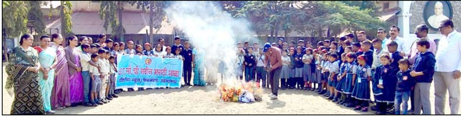
नवीन मराठी शाळा विश्रामबाग प्रशालेतील विद्यार्थ्यांनी केली घातक चायना-नायलॉन मांज्याची होळी.