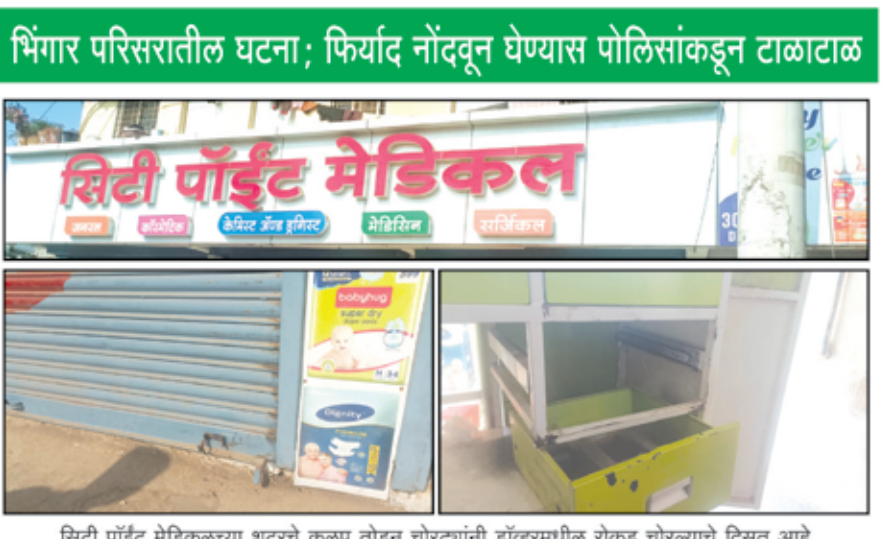
सिटी पॉइंट मेडिकलच्या शटरचे कुलूप तोडून चोरट्यांनी ड्रॉवरमधील रोकड चोरल्याचे दिसत आहे.

नगर - भिंगार जवळील वडारवाडी येथे नगर - पाथर्डी रोडलगत असलेले मेडिकल दुकान अज्ञात चोरट्यांनी फोडून दुकानातील ड्रॉवरमध्ये कर्मचाऱ्यांच्या पगारासाठी ठेवलेली २८ हजारची रोकड चोरून नेल्याची घटना सोमवारी (दि.३०) सकाळी उघडकीस आली आहे. चोरीची ही घटना सीसीटीव्हीत कैद झाली असून, २ चोरट्यांनी ही चोरी केल्याचे सीसीटीव्ही फुटेज मध्ये दिसत आहे.