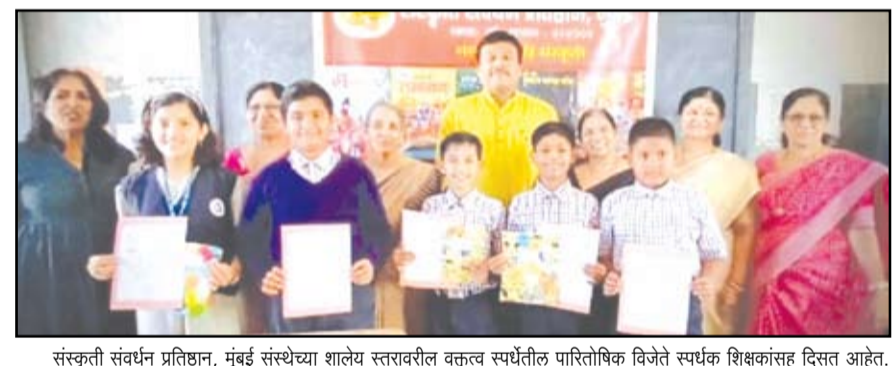
संस्कृती संवर्धन प्रतिष्ठान, मुंबई संस्थेच्या शालेय स्तरावरील वक्तृत्व स्पर्धेतील पारितोषिक विजेते स्पर्धक शिक्षकांसह दिसत आहेत.

नगर - मुंबई येथील संस्कृती संवर्धन प्रतिष्ठानची अहिल्यानगर शाखा नगरमध्ये गेली तीन वर्षे १८ शाळांमध्ये संस्कृती संवर्धनाचे काम करीत आहे. विशेषतः संस्था शाळांमध्ये रामायण, महाभारत संतकथा, क्रांतिकारी लोकांविषयी मुलांना माहिती द्यावी, यासाठी काम करते. शाळेमधील मुलांना वरील विषयांवरची पुस्तके दिली जातात व जानेवारीमध्ये त्या मुलांची परीक्षा घेतली जाते, जी मुले जास्तीत जास्त मार्कांने पास होतात त्यांना सुवर्णपदक देऊन त्यांचा सत्कार करण्यात येतो. याच संस्थेच्या अंतर्गत विविध कार्यक्रमा ही घेतले जातात. मुलींना स्वतःचे संरक्षण कसे करावे स्वयंसिध्दांचा अंतर्गत वकील, पोलिस व जुडो कराटे मधील लोकांना बोलवून शाळेमधील मुलांना प्रशिक्षण व मार्गदर्शन केले जाते. शिवाय मुलांना वेगवेगळे विषय देऊन निबंध स्पर्धा वक्तृत्व स्पर्धा ही घेतल्या जातात.