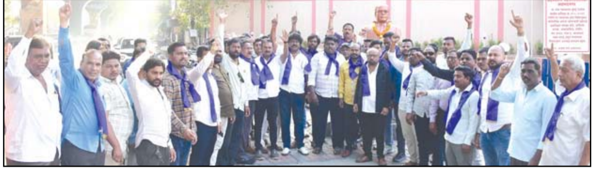
परभणीतील घटनेचा नगर शहरात आंबेडकरी समाजाच्यावतीने मार्केटच्याई येथील डॉ.बाबासाहेब आंबेडकर यांच्या पुतळ्यासमोर निषेध व्यक्त करून निदर्शने करण्यात आली.

नगर - परभणी शहरामध्ये डॉ.बाबासाहेब आंबेडकर यांच्या पुतळ्यासमोर ठेवण्यात आलेल्या संविधानाच्या प्रतिकृतीची एका अज्ञाताने मंगळवारी सायंकाळी तोडफोड करून विटंबना केल्यामुळे समस्त आंबेडकरी समाजाच्या वतीने निषेध नोंदवून मार्केटच्याई येथील डॉ.बाबासाहेब आंबेडकर यांच्या पुतळ्यासमोर निदर्शने करण्यात आली.