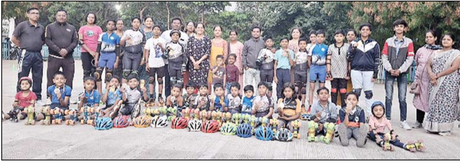
जिल्हास्तरीय स्पर्धेत पदके पटकाविणारे टिम टॉपर्सच्या स्केटिंग खेळाडू तसेच त्यांचे मार्गदर्शक शिक्षक.