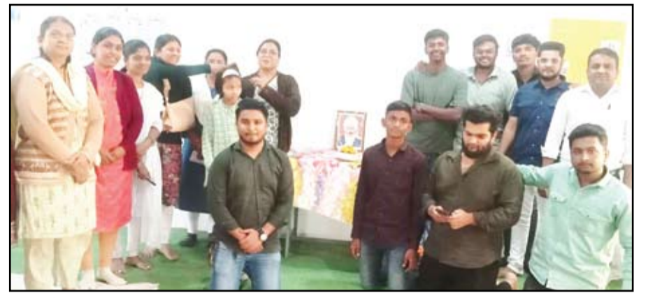
के.जी. कला व वाणिज्य महाविद्यालयात भारतीय भाषा उत्सव साजरा करण्यात आला.