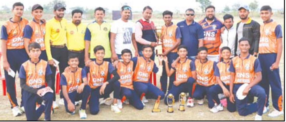
एस के अकॅडमी आयोजित अहिल्यानगर प्रीमियर लीग क्रिकेट स्पर्धेत गॅलेक्सी नॅशनल स्कूल विजेता तर आर एल टायटन्स संघ उपविजेता ठरला.