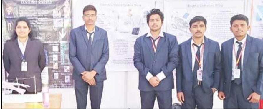
अविष्कार २०२४-२५ संशोधन स्पर्धेत आयबीएमआरडीच्या ३ प्रकल्पाची निवड करण्यात आली.