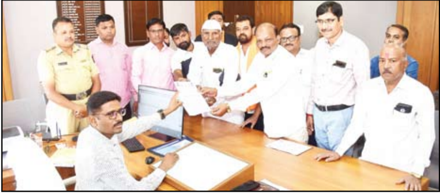
सरपंचाच्या खून प्रकरणाची चौकशी करून आरोपीवर कायदेशीर कारवाई करा, या मागणीचे निवेदन अखंड मराठा समाजाच्या वतीने जिल्हाधिकाऱ्यांना देण्यात आले.