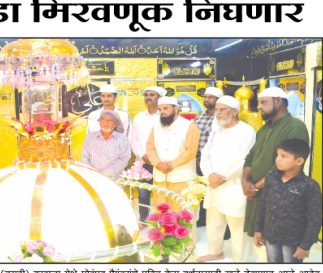
नगर शहरातील टाट्टी (दाडी) दरवाजा येथे मोहंमद पैगंबर यांचे पवित्र केस दर्शनासाठी खुले ठेवण्यात आले आहेत.