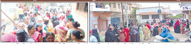
लाडकी बहिण योजनेच्या कागदपत्रांसाठी मिंगार तलाठी कार्यालय आणि कार्यालयाबाहेर महिलांची झालेली मंती.

रिझर्व्हालांकवृत्ती अर्जांच्या सव्या भाडेवसुली, जिल्हा प्रशासनाची मात्र बघ्याची भूमिका तलाठी कार्यालयाकडून या महिला आणि नागरिकांनी प्रथम आर्थिक लूट केली जात आहे. रिझर्व्हालांकवृत्ती २५० रुपये, उरपाचा दाखला २५० रुपये, अंश भरण्यासाठी ५० रुपये असे अवधीची शुल्क अकारण घेत असून, नागरिकांची मोठी आर्थिक लूट केली जात आहे. त्याचबरोबर या कार्यालयपत्रात घेण्यासाठी रिझर्व्हालांकवृत्ती लाभार्थी प्रशासकांकडून उरपाच्या व रिझर्व्हालांकवृत्ती घडती कायद्यावर दाखला देण्यासाठी नागरिकांनी तलाठी कार्यालयात येऊन आले आहेत.