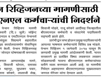
जॉईंट फोरम ऑफ मीएसएएल व एमटीएएएल व मनसूर अयोगिएएनव्या संयुक्त विद्यमान शहरातील मीएसएएलच्या मुख्य कार्यालयासमोर संतोषविभूत कर्मचाऱ्यांनी निदर्शने केली.