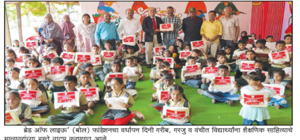
बोल फॉउंडेशन (बोल) फाउंडेशनचा वर्धापन दिन साजरा. नगर व जयंती निमित्त विद्यार्थ्यांना शैक्षणिक साहित्य देण्यात आले.

नगर - बोल फॉउंडेशनद्वारे २४ वर्धापन दिन साजरा करण्यात आला. बोल फॉउंडेशनद्वारे २४ वर्धापन दिन साजरा करण्यात आला.