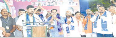
महायुतीचे उमेदवार डॉ.सुजय विखे यांच्या प्रचारार्थ शिवालय संरक्ष मत्ताना केंद्रीय सामाजिक न्याय मंत्री रामदास आठवले.

संविधान मजबूत करण्याची मते मोदींनी घेतली आहे. या निवडणुकीत परदेशीतून मोदींना मिळत असलेला प्रस्ताव पहाता नरेंद्र मोदींचा विचाराचा पक्ष एवढ्या ताकदीने वृत्त पहाता आहे जी तो पक्षाने आता बजवत आहे. हा पक्ष वर कोणी अडवता तर पक्षात आठवे केल्या शक्यात आम्ही कर्तव्य राखित नाही, असे प्रतिपादन आरक्षीआयचे अध्यक्ष व केंद्रीय सामाजिक न्याय मंत्री रामदास आठवले यांनी करून नगर मजूर महायुतीच्या उमेदवार सुजय विखे यांनाच दिलेल व सर्व समाजांनी मतदान करून विजयी करणे, असे आवाहन त्यांनी केले.